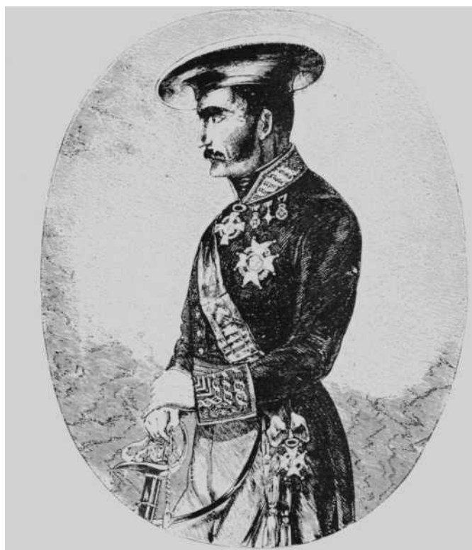
D. Tomás Zumalacárregui.