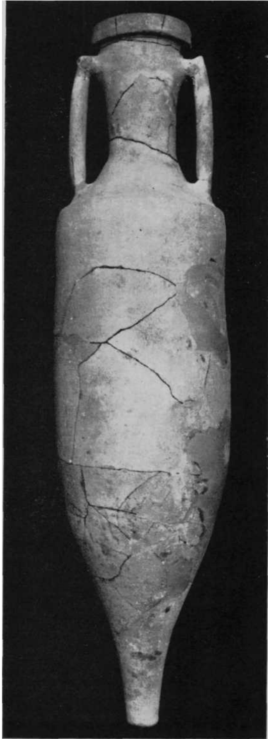
Fig. 2--Anfora romana procedente de Cascante (Navarra)