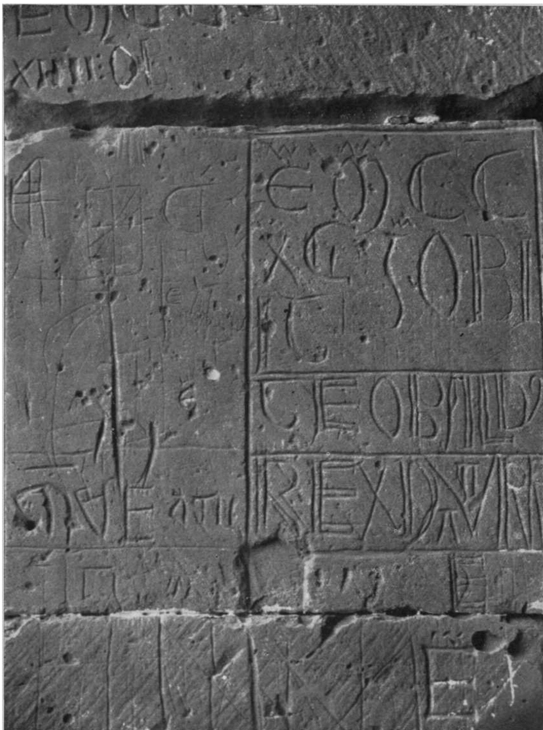
Inscripción epigráfica con la fecha de la muerte de Teobaldo I, en lo puerto de la iglesia de Castiliscar