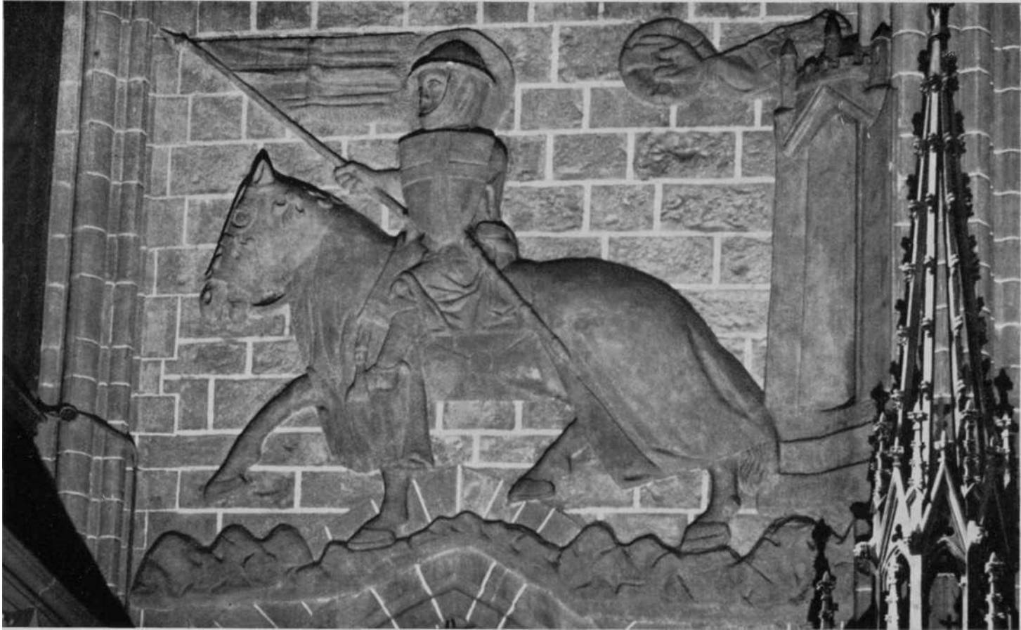
Relieve del Caballero Cruzado