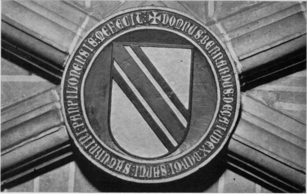
Escudo de la Casa de Eza