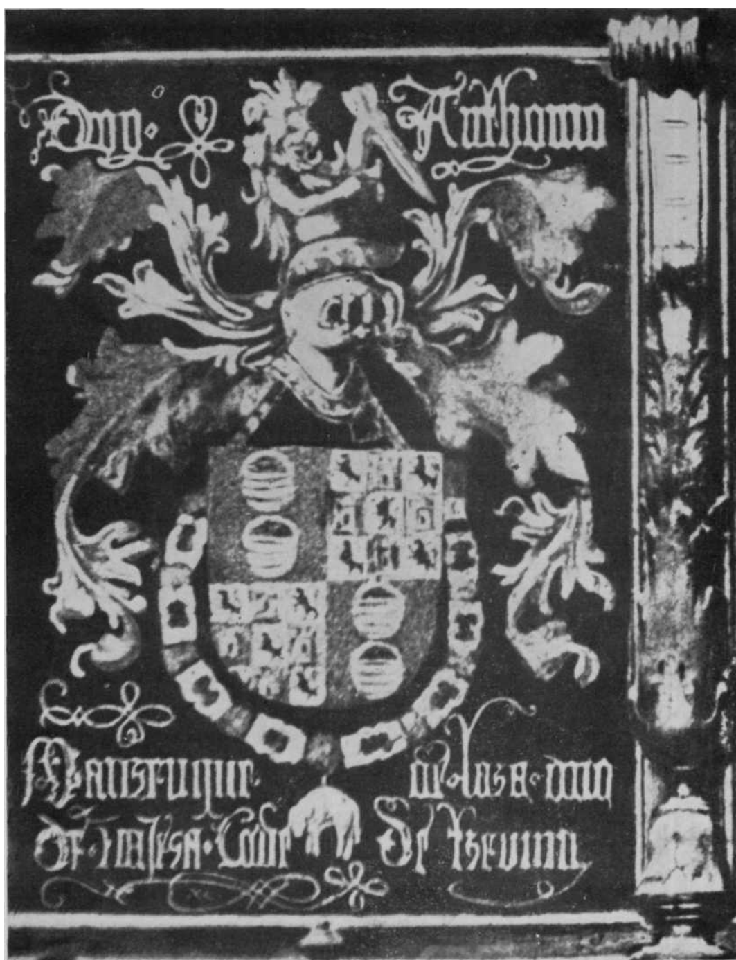
Escudo del Duque de Nájera, Virrey de Navarra, 1518, en la sillería del Coro de la Catedral de Barcelona.