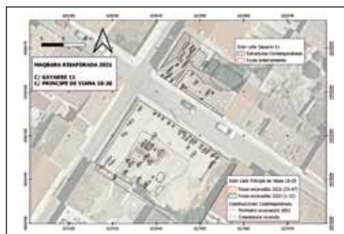
Figura 2. Distribución de las fosas en áreas excavadas.

En cuatro fosas de Gayarre, 11 (fosas 2, 3, 12 y 13) se ha podido constatar la presencia de adobes dispuestos sobre los restos óseos del enterramiento. Estos adobes probablemente fueron colocados para separar el cuerpo del relleno superior de gravas. En 3