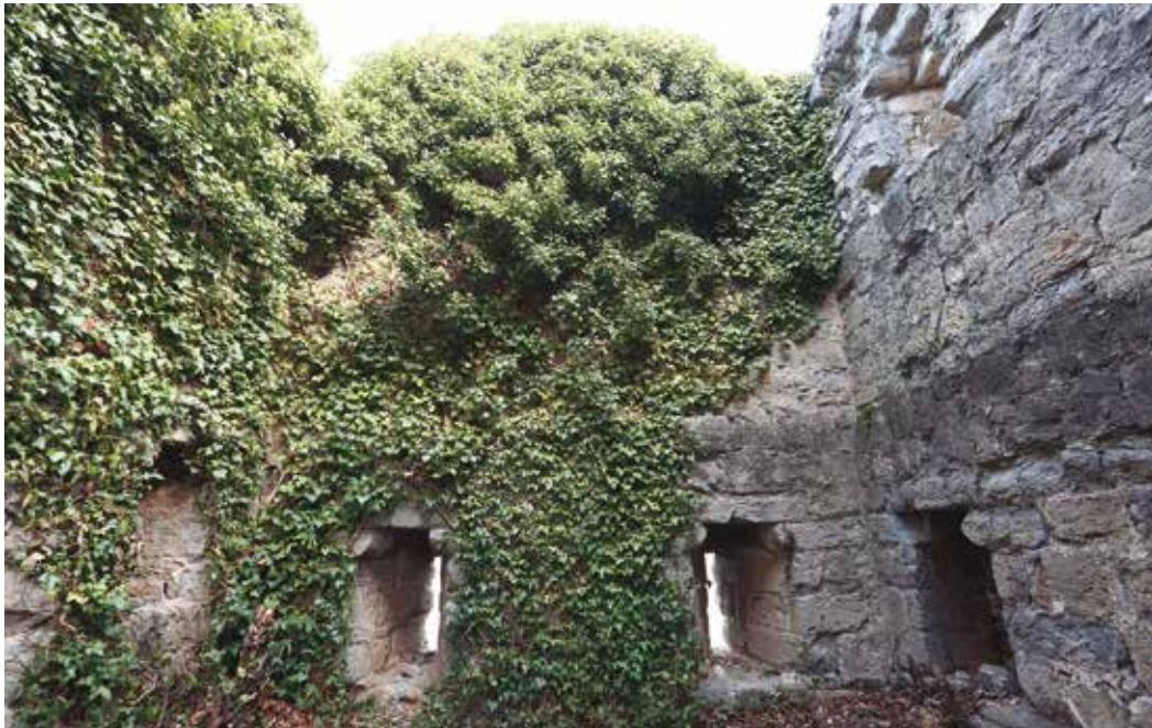
Figura 3. Vista frentes sur y oriental, e interior de la torre (Javier Sesma).