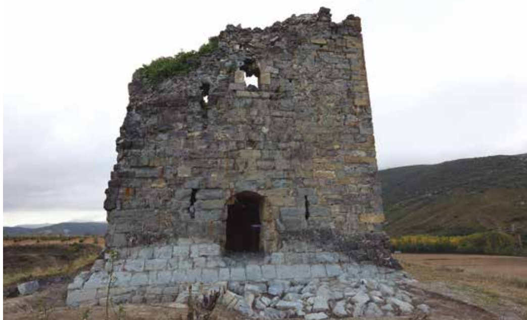
Figura 2. Vista cenital de la torre y testimonios descubiertos (Goio Seminario) y fachada occidental.