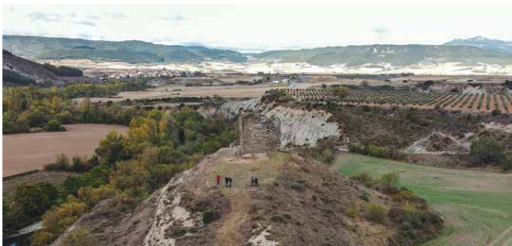
Figura 1. Vista aérea de la torre de San Gregorio (Goio Seminario).

Dentro de las acciones que el Ayuntamiento de Lumbier esta llevando a cabo para dar a conocer su patrimonio natural y cultural, se enmarca la campaña de excavaciones realizada en la torre de San Gregorio, situada en un pequeño altozano, del término municipal de Lumbier, sobre la terraza aluvial o «saso» del río Salazar, que en la parte superior presenta unas dimensiones de 105 m de longitud y 35 m de anchura. El topónimo donde se encuentra la torre es «San Gregorio».