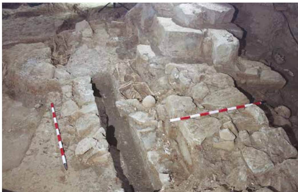
Figura 2. Enterramientos del siglo XVI sobre estructuras islámicas.

Siguiendo con los que nos aparecieron el año anterior, ha aparecido un tercer apoyo de una alineación de sillares que siguen la misma orientación que la iglesia del siglo XVI, no descartando que puedan aparecer más. Viendo que hay enterramientos que se