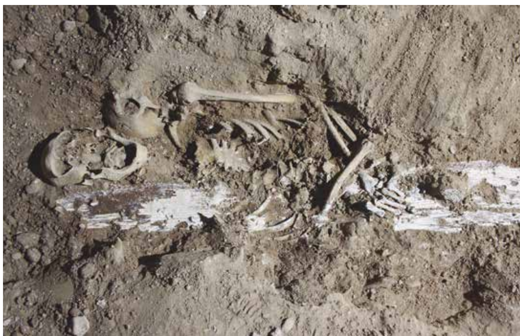
Figura 1. Enterramiento con resto de ataúd con pintura blanca.

En la excavación de estos enterramientos nos ha llamado la atención el hallazgo de varios ataúdes, concretamente cinco, pintados en blanco, además para individuos adultos. En niveles más modernos, siglo XIX, estos habían aparecido solo para niños, siendo los pintados en negro los únicos que se habían visto conservados para adultos. Una apreciación más detallada parece indicar que en algunos, esta pintura no estaría solo al exterior, sino también al interior de los ataúdes, pues la pintura blanca queda marcada con las vetas de la madera directamente sobre los huesos.