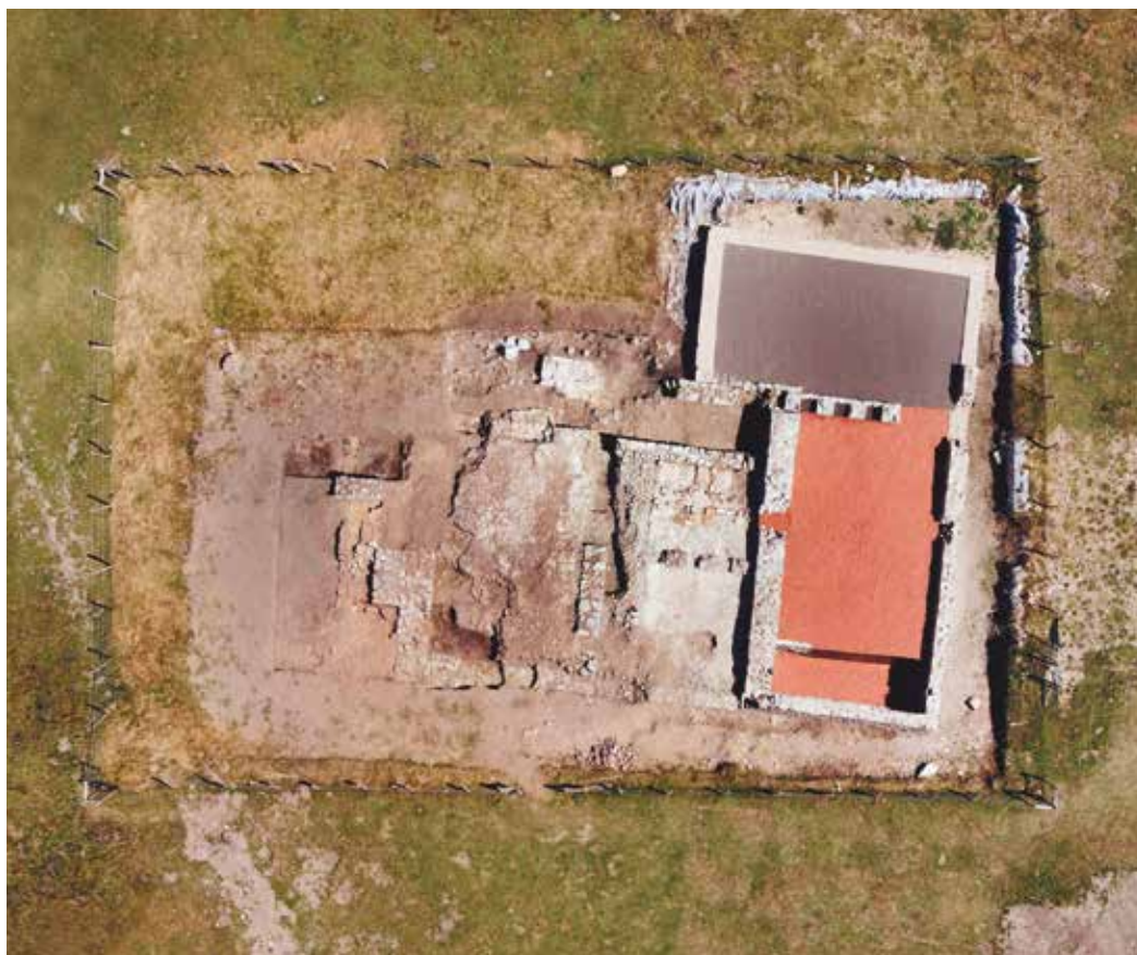
2. irudia. Termen eraikinaren aire argazkia 2020ko indusketa kanpaina amaitu ostean. Egilea: J. Etxegoien.

garaikoa (K.o. 324-337) den txanpon bat identifikatu da 2 eta horrek egituraren erabilera K.o. IV. mendearen erdigunean kokatzen du. Gainera, erlazio estratigrafikoak adierazten du betekin hau osatzen den momentuan termaguneko pareta batzuk dagoeneko abandonu egoeran daudela. Beraz, esan daiteke garai horren inguruan termen konplexua, zonalde horretan behintzat, jatorrizko funtzioetik kanpo egongo zela, mota horretako jarduera produktiboak ez baitziren bateragarriak termen erabilerarekin.