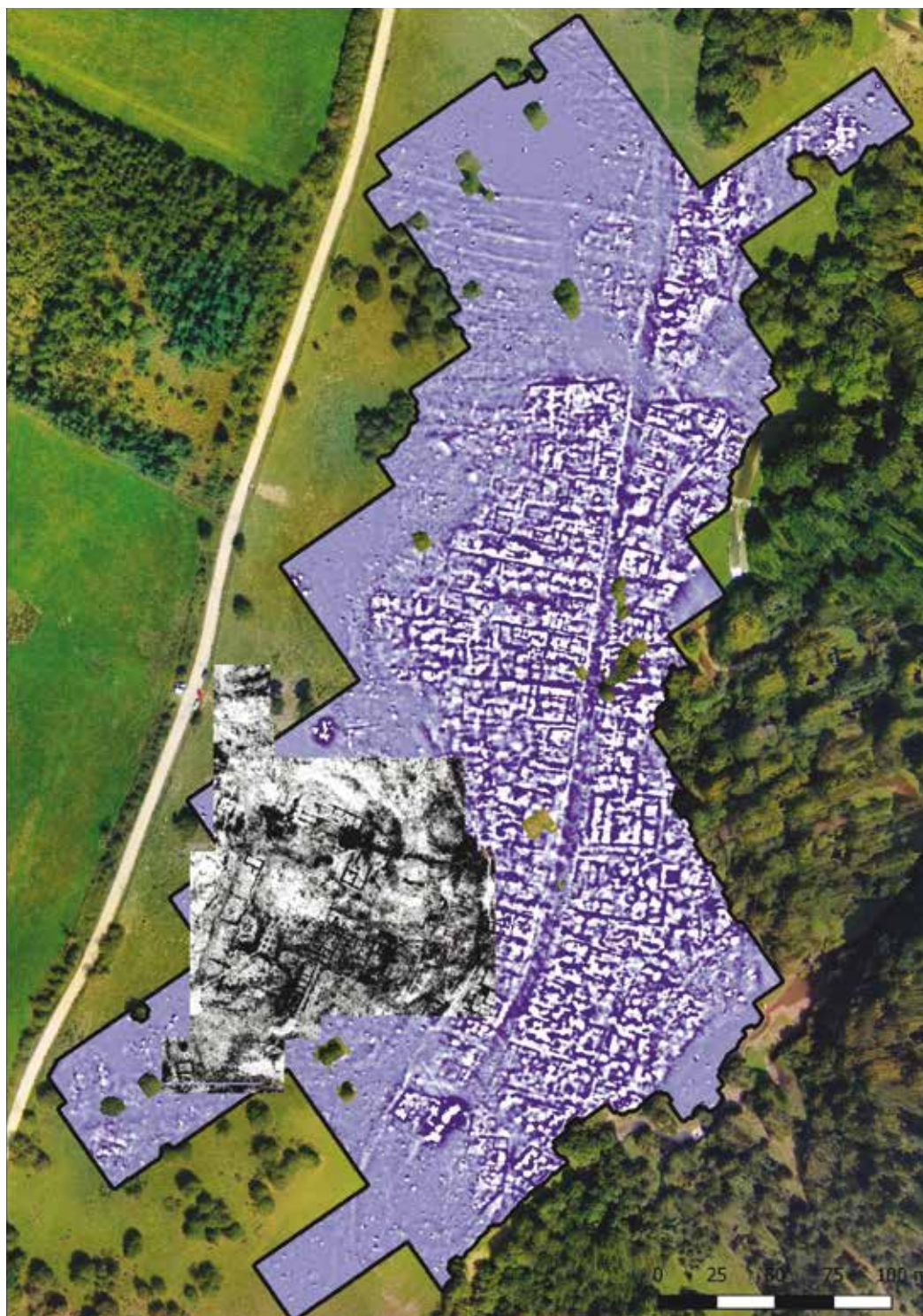
1. irudia. Miaketa geofisikoen emaitzak (txuri beltzean georradarrarenak eta txuri urdinean magnetikoarenak). Egilea: E. Garcia-Garcia.