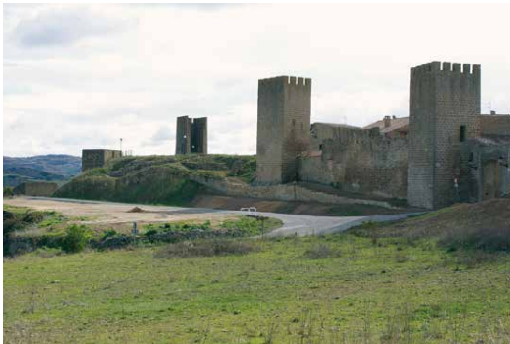
Figura 2. Aspecto final del tramo del frente norte consolidado.

segundo recinto exterior o falsabraga, que se ha ido viendo que recorre si no la totalidad, si buena parte del perímetro amurallado. Su progresiva limpieza y consolidación, especialmente en el frente norte que es donde mejor parece conservarse, permite mostrar la complejidad de este recinto amurallado, con la existencia de un doble encintado, accesos complejos en recodo, etc. Su progresiva excavación, limpieza y consolidación ayudarán a mejorar la visión y comprensión de este importante enclave navarro, haciendo además partícipe a la población local de la importancia de la recuperación y cuidado del patrimonio. La continuación de estos trabajos en campañas sucesivas permitirá continuar con esta importante labor.