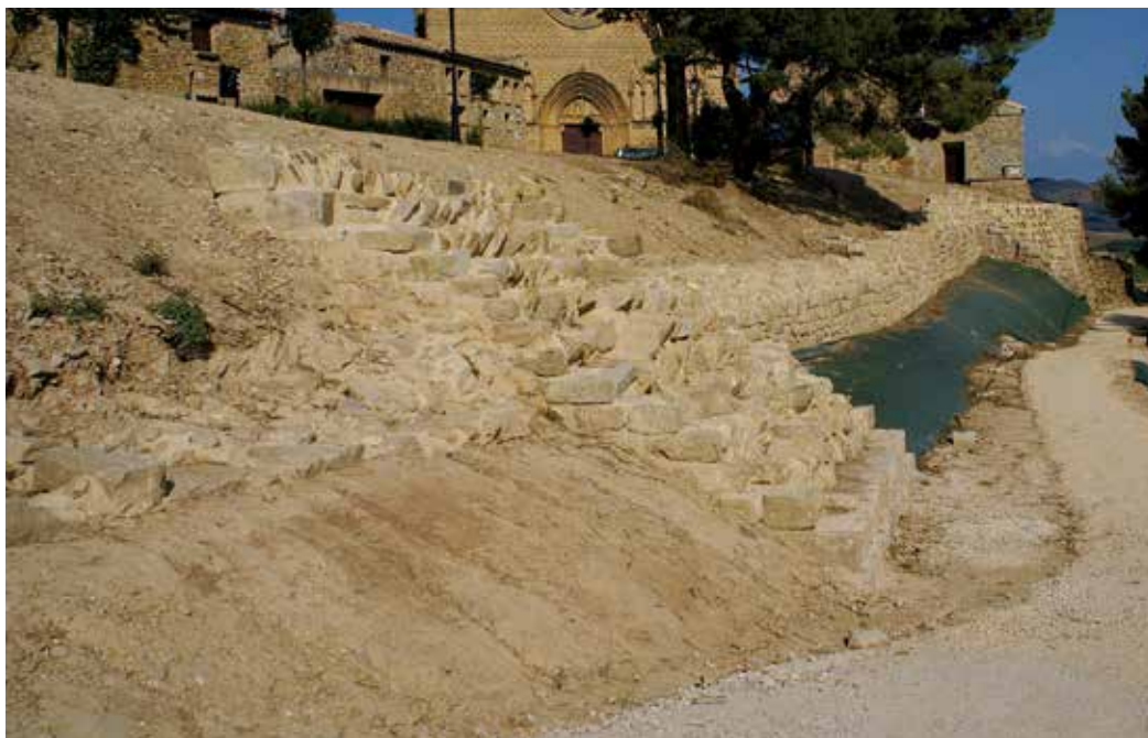
Figura 1. Aspecto final del tramo del frente sur consolidado.

La consolidación y recrecimiento debía realizarse mediante el aporte de nuevas hileras de piedra a los tramos de muralla y bestorres descubiertas en la excavación arqueológica, empleando piedra de similares características (arenisca local), morfología y talla.