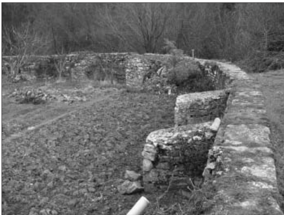
Restos del muro y contrafuertes junto al puente del Calvario.

La explotación hortícola de la zona de Ezpeleta es también antigua. Diversos particulares, muchos vecinos de Huarte y sobre todo, los monjes de Roncesvalles son sus primeros protagonistas. Por ejemplo, consta que en 1212 la Colegiata dio a censo a favor de Miguel de Echálaz sus heredades en los términos de la localidad, que comprendían un total de 3 huertos, 6 piezas y 1 casal. Una de las piezas –de 3 arrobas de extensión– se encontraba en Ezpeleta. A mediados del siglo XIII los monjes cambiaron un huerto que tenían en el referido término por otro y unas viñas junto a la casa de Atarrabia en Villava. En 1374 compraron a los racioneros de la iglesia de San Esteban de Huarte una viña que lindaba con el ryo mayor d'Uart et de Ezpeleta 19 .