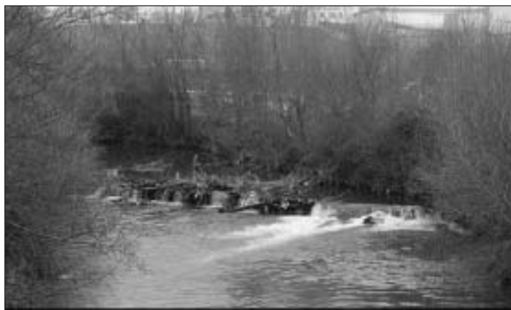
La “Paradera”, presa provisional para el regadío de Ezpeleta desde 1907. La primera fotografía corresponde a junio de 2002, mientras que la segunda es de enero de 2005.

Para la elevación del agua en las 4,5 robadas (4.041 m 2 ) del “regadío seco” se empleaban en Huarte las conocidas sacaderas o goldaberako 113 . Hoy no se conservan, aunque los vecinos han recreado algunas. Se trataba de una especie de brazos articulados de madera que permitían “sacar” el agua allí donde la regata no lo hacía por su propio pie por falta de nivel.