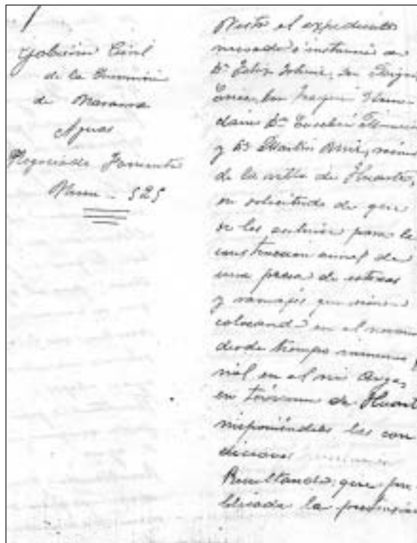
Autorización del Gobierno Civil de Navarra (Fomento-Aguas) para construir una presa de regadío en Ezpeleta, 1907