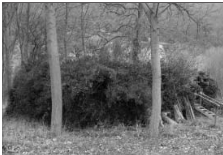
Restos de la torre de Ezpeleta en junio de 2002 y, la última fotografía, en enero de 2005