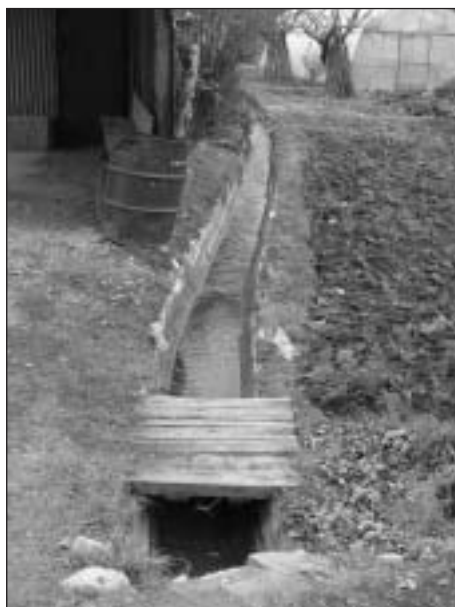
Una de las acequias que surcan el término de Ezpeleta.