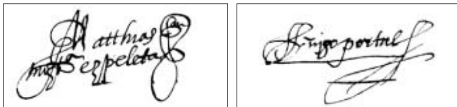
Firmas de Matías Motza de Ezpeleta y de Íñigo Portal, propietario y arrendatario de Ezpeleta respectivamente en 1576 (AGN, Sección de Tribunales Reales. Procesos , núm. 28.728, fol. 10r y 16r)

cados a Catalina del Río 64 . En 1586-1588 ambas partes volvieron a pleitear, ya que Juan de Lerruz no devolvió la llave del molino al finalizar su alquiler y además parece que se llevó consigo parte del instrumental 65 .