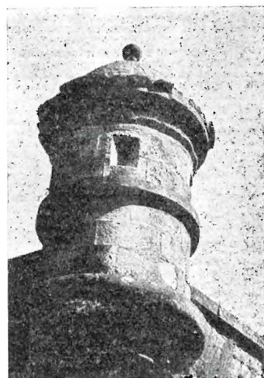
Urraka (Urraca) 1283 Usoa (Ussoa) s. XII