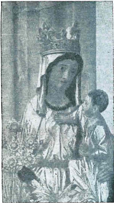
Ibañetako elurren txuria, neguan, eta uda beroan pago beso zabalen itzala! Erran nahiaren ezin erranak —zure inguruan—, Orriaga'ko Ama Birjiña.

Mendi gain ortan zeru zabala, muga gabeko Ama baten bihotzak. Zoin apal mendiak eta, gizona ain itsu, Añamendiko Erregina!