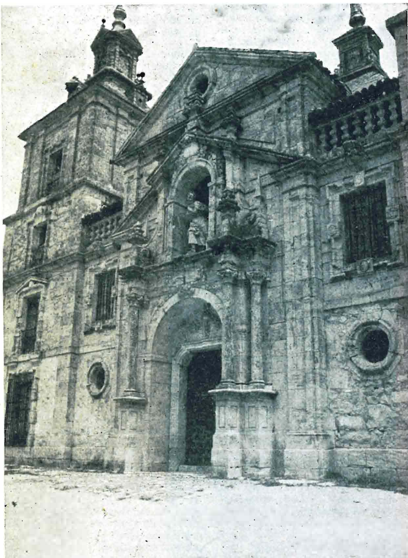
"BAZTAN BERRIA" ERRIKO ELIZA