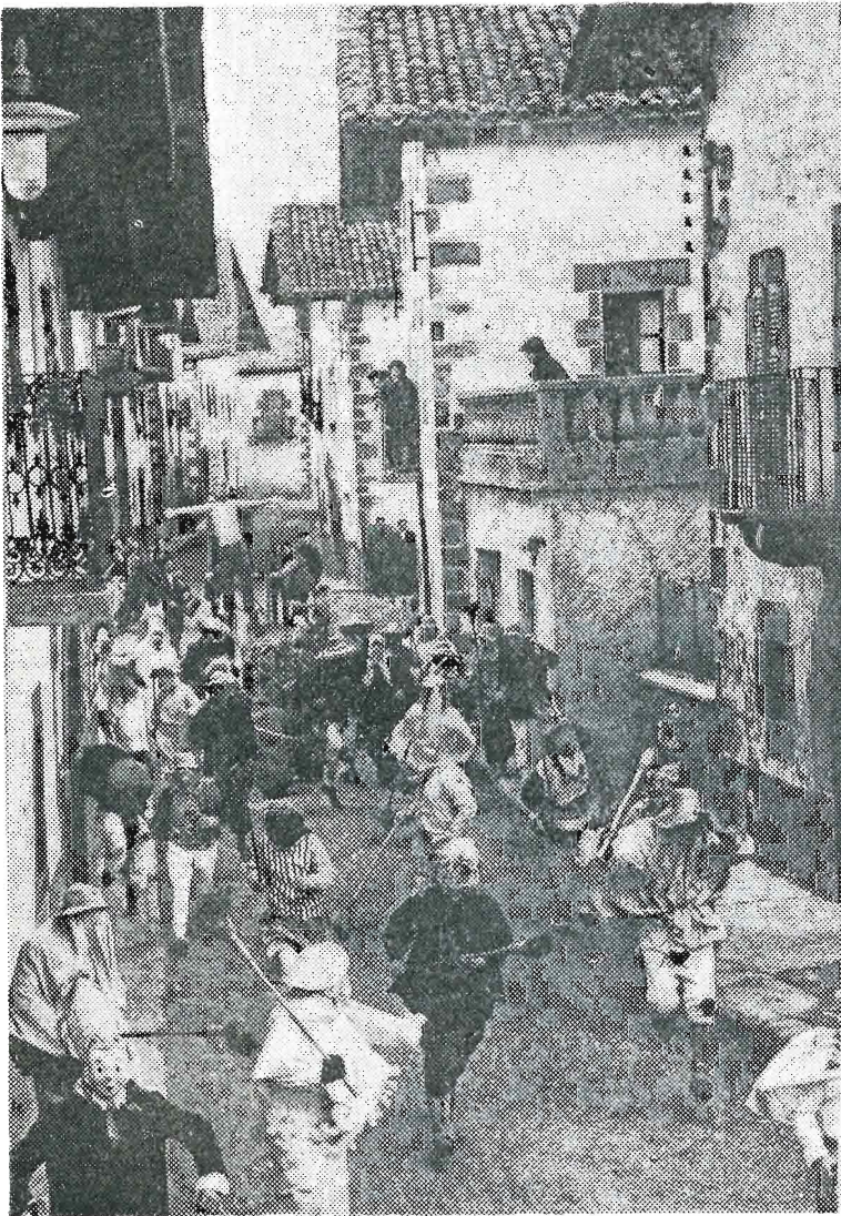
Iñautearen moztarok-taldea (multzoa) Lanzko kalean zear ibilketan.

Gure Euskalerraren oitueraz zarrerenetako dan Lanzko Iñaute au benetan ikusgarria da.