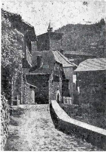
Isabako alderdi baten ikusbidea.

Nonta orai, zahar utzulik, uskaraz ele-erran bear! Anitx azetu dugu, baia, guziareki, arinago egonen da mihia mintzotako, ezik eskiak egitako. Korrengatik, badakid kau kola-kala erkinen dela, eta Uruñan agertan den paper berrian ekusiren deinek, parkatu bear ekunen dei.