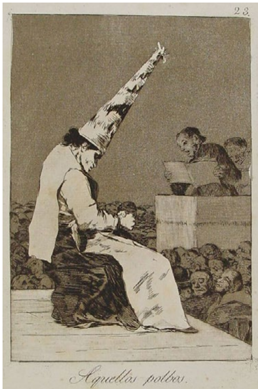
Figura 1. Francisco de Goya, Capricho 23: Aquellos polvos , 1799. Grabado al aguafuerte, aguainta bruñida, punta seca y buril. Biblioteca Nacional de España, Invent/45653(23).