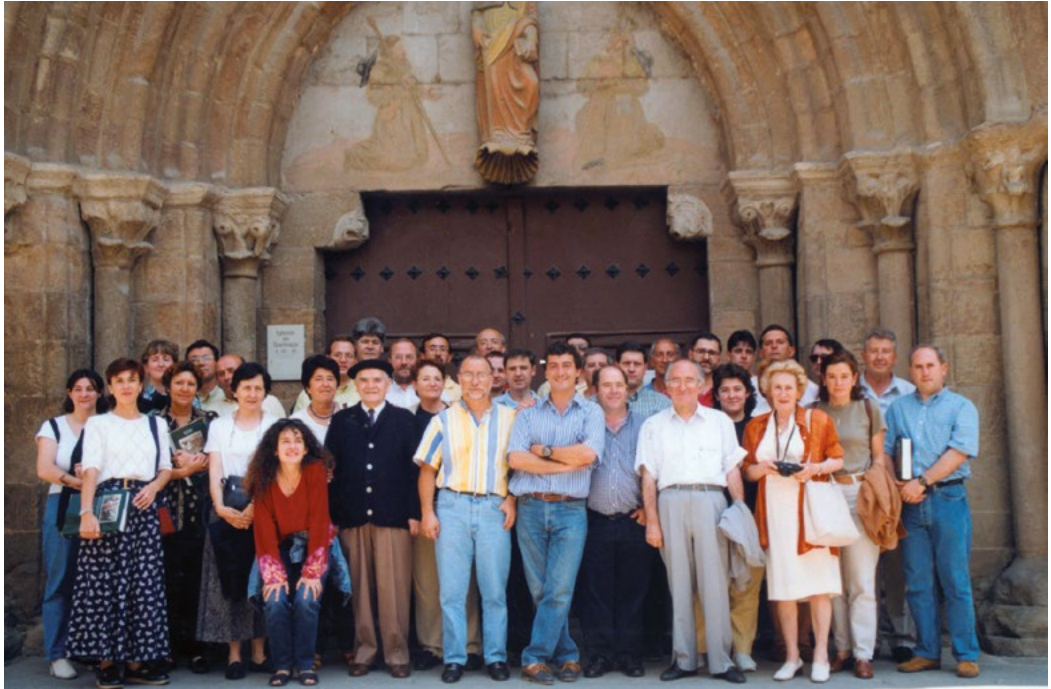
Figura 1. Reunión de los grupos Etniker celebrada en 1998 en Sangüesa.