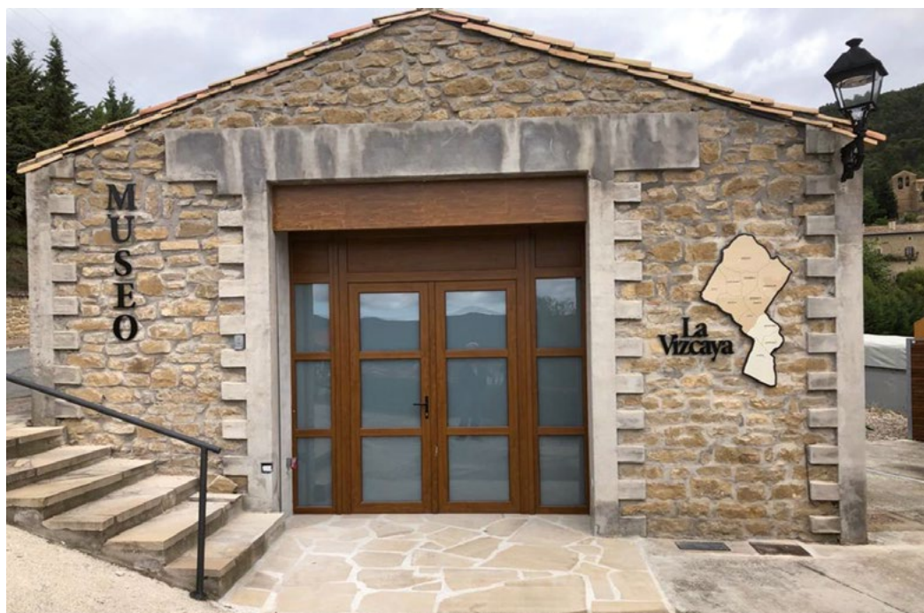
Figura 4. Futuro museo dedicado a la Bizkaia que próximamente se podrá visitar en la localidad de Ayesa.