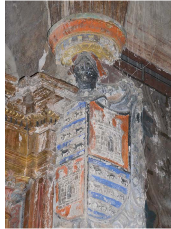
Figura 4. Escudo de Góngora.

Así pues, ya para finales del siglo XV, el «noble señor» Charles de Góngora se convertía en el joven señor de los palacios, lugares y casas de Góngora, Ciordia, Olazagutía, Yaben y de la casa, granja y ermita de San Adrián de Vadoluengo (por parte de su mujer), propietario de los diezmos de las parroquias de los tres primeros lugares y poseedor de los dos mayorazgos de su casa, aunque no exento por todos ellos de enfrentamientos con sus hermanos o sobrinos que, por una razón u otra, pleitearon por la propiedad de los mismos.