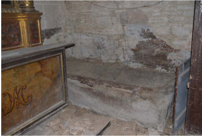
Figura 3. Sepulcro de Góngora 10 .