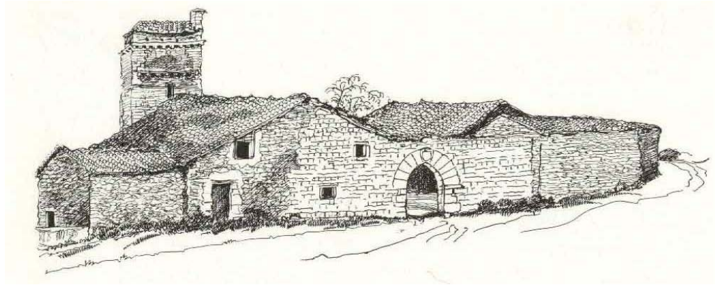
Figura 2. Palacio de Góngora. Julio Caro Baroja, La casa en Navarra , III. Pamplona: Caja de Ahorros de Navarra, 1982, p. 24.