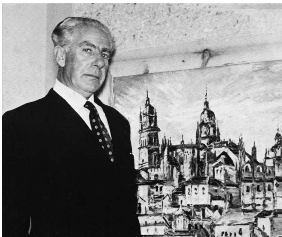
Figura 2. Noviembre de 1955, sala García Castañón. Exposición de Benjamín Palencia.

maestro dentro de la pintura española (fig. 2). Se mostraron en la citada exposición veinte óleos y, la misma, resultó un acontecimiento excepcional en la Pamplona de la época, contando también con un cuidado catálogo (fig. 3). La inauguración se llevó a cabo con todas las autoridades del momento, Luis Arellano, presidente de la junta de gobierno de la CAMP, Javier Pueyo, alcalde de Pamplona, Felipe Zalba, presidente de la Audiencia, Miguel Javier Urmeneta, director de la CAMP, etc. Se calculó que unos quince mil pamploneses visitaron la exposición, en una Pamplona de apenas ochenta mil habitantes. Incluso se vendió una de las obras expuestas, adquirida por don Félix Huarte en la importantísima cantidad de veinte mil pesetas. La prensa pamplonesa de la época dio sobrada