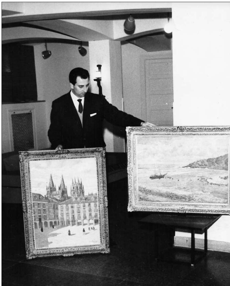
Figura 7. Exposición Darío Regoyos. García Castañón, noviembre de 1964.

tendencias pictóricas más avanzadas como fueron los grabados de Joan Miró o los óleos de Juan Barjola y Joaquín Vaquero Turcios 23 . Todos estos nombres demuestran a las claras el paso que se da en esta sala de arte desde al arte local a un visión del arte global. Las exposiciones colectivas mostraron también el arte más avanzado del momento, con obra de artistas que abrían camino dentro de las nuevas tendencias de la abstracción. En junio del año 1956 se exhibió la exposición titulada «Arte abstracto español», con la presencia de los artistas más rompedores de la vanguardia española; el año 1964 se hizo lo propio con la muestra «Artistas españoles contemporáneos», en donde se exhibía obra de