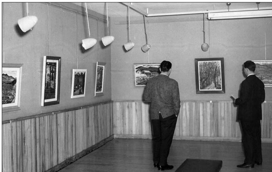
Figura 6. Exposición Retana (1959) en sala García Castañón.