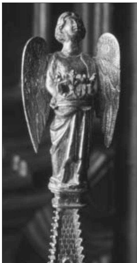
Fig. 12. Relicario del Santo Sepulcro. Detalle del ángel de la aguja.

te culmina en una aguja formada por un cuerpo con tracerías y un esbeltísimo remate piramidal en el que apoya un ángel que sostiene en sus manos una corona (fig. 12), única posible alusión a la presencia de una santa espina 46 . En el interior se desarrolla una escena de la Visitatio Sepulcri , con un sarcófago de plata cubierto de cristal, leones en el basamento y frente adornado por tres óculos que contienen esmaltes. El ángel toma asiento en un lateral del sarcófago. Las santas mujeres se reparten: una a un lado y dos detrás del sepulcro. Dos soldaditos dormidos ocupan los extremos, dejando entre ellos espacio para un tapete con dados, una jarra y cubiletes.