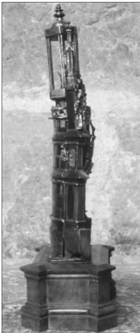
Fig. 5 Relicario de la Santa Espina. Estado actual.

a) Su peculiar conformación obedece a que desde el principio fue pensado para incorporarse a una obra preexistente, motivo que explica la ausencia