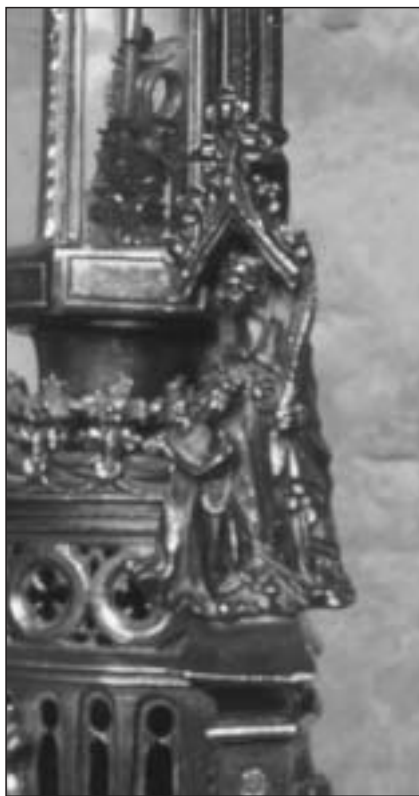
Fig. 7. Relicario de la Santa Espina. Detalle de la reina en oración.

Existen apoyos circunstanciales para esta atribución. Por una parte, sabemos que doña Blanca fue muy devota, especialmente de la Virgen María, como lo demuestran sus peregrinaciones a Ujué, al Pilar de Zaragoza, a Guadalupe y a Santa María de Nieva, donde murió y fue enterrada. Por otra, el que decidiera ser representada en forma semejante a ésta (si bien en pie, no arrodillada) en uno de los pilares del claustro de Santa María de Olite. Por desgracia, no conservamos sus cuentas previas a acceder al trono navarro, donde hubiéramos podido documentar la ejecución de la obra. Por último, no resulta habitual que una reina como doña Leonor se hubiera hecho representar ante la imagen de Santa María sola, sin su marido, en vida de éste 33 .