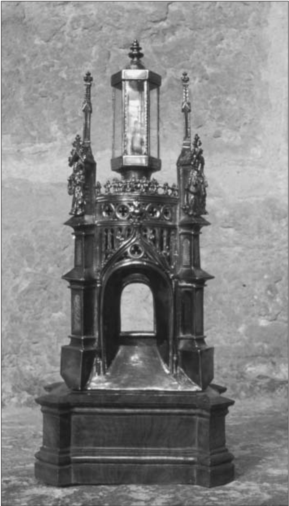
Fig. 2. Relicario de la Santa Espina de la Catedral de Pamplona. Estado actual (foto autor).