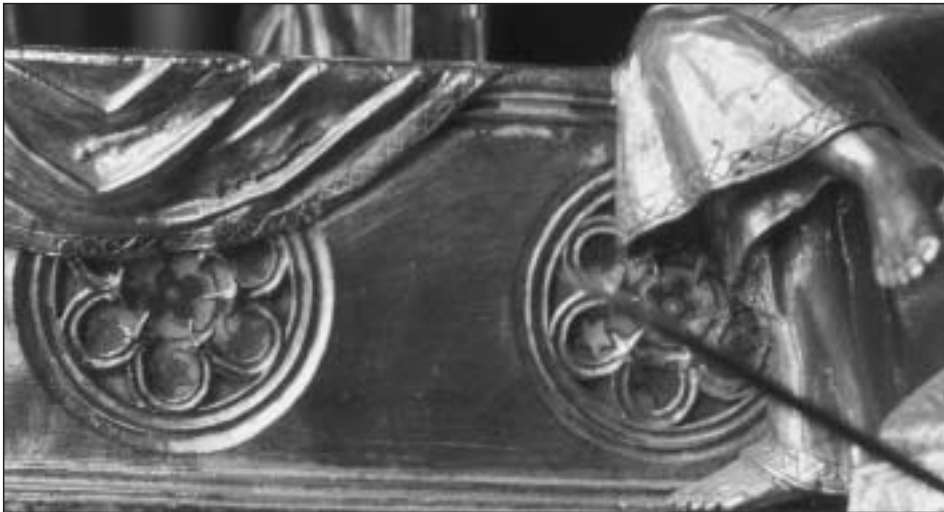
Fig. 14. Relicario del Santo Sepulcro. Detalle de los esmaltes del sarcófago.