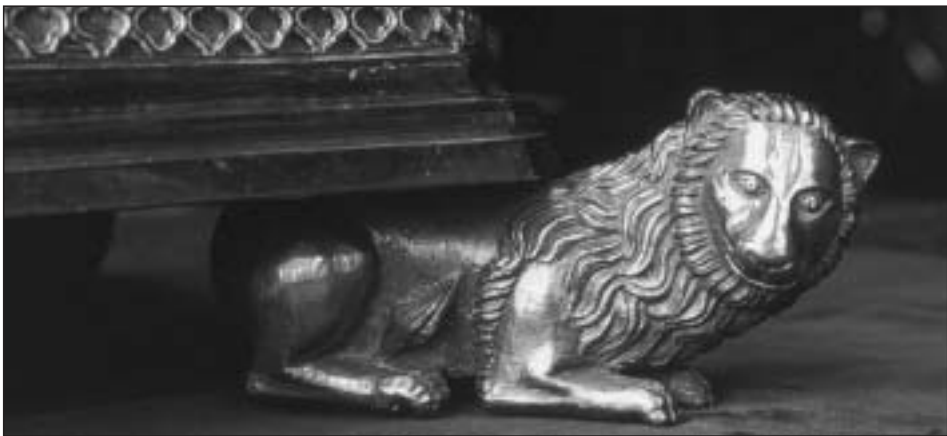
Fig. 17. Relicario del Santo Sepulcro. Detalle de uno de los leones del basamento.

ten los argumentos de otra naturaleza hasta ahora expuestos. Creo que no es así. A este respecto, resulta significativo que el estudio más detallado sobre estatuillas realizadas por orfebres góticos mantenga para el relicario pamplonés la cronología tradicional hacia 1255 63 .