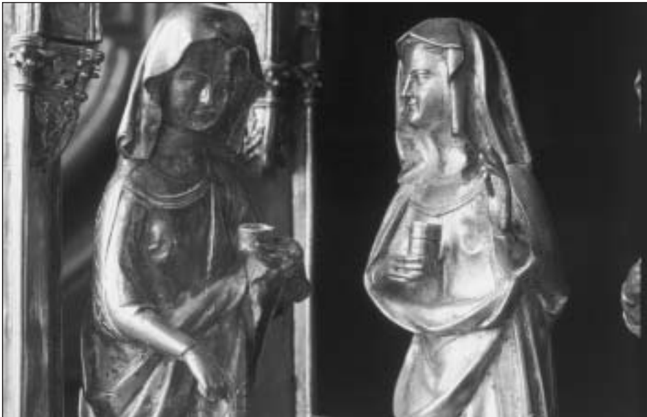
Fig. 15. Relicario del Santo Sepulcro. Detalle de las santas mujeres.

gas de una imagen femenina del claustro catedralicio de Burgos, concretamente la llamada “doña Violante” (o “doña Beatriz”), tallada a mediados del siglo XIII.