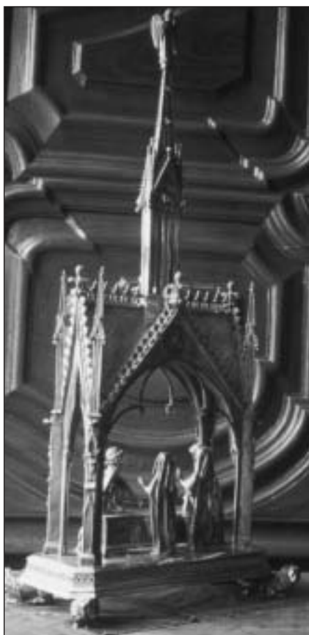
Fig. 11. Relicario del Santo Sepulcro. Estado actual, vista posterior.