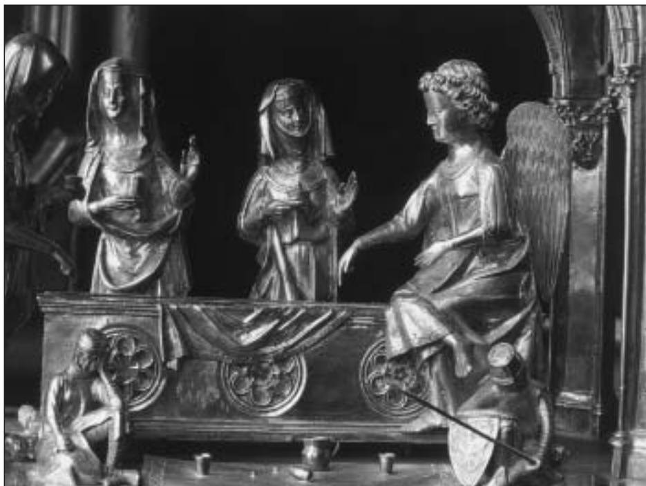
Fig. 3. Relicario del Santo Sepulcro. Detalle de la Visitatio Sepulchri.

Averiguar cuál fue la dedicación original del relicario del Santo Sepulcro ayuda a comprender su iconografía e incide de lleno en la polémica acerca de su cronología. Ya he dicho que muchos lo han considerado regalo de San Luis, argumentando que contenía una espina por él donada. Sin embargo, tal dedicación en ningún modo se corresponde con la escena desarrollada en el interior del templete, que muestra la visita de las Tres Marías al Santo Sepulcro durante la mañana del domingo de Resurrección (fig. 3).