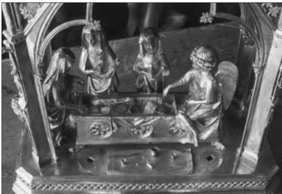
Fig. 10. Relicario del Santo Sepulcro. Composición sin los soldados.

están las fuentes escritas, que a mi juicio resultan especialmente valiosas. También lo relativo a su composición, es decir, la idea general de la pieza. En tercer lugar, la utilización o no de ciertas técnicas en los esmaltes que adornan el frente del sepulcro y los óculos de los gabletes. En cuarto, algunos rasgos estilísticos concretos, como modos de trabajar rostros y plegados en las estatuillas. Conviene repasarlos todos antes de proponer una conclusión.