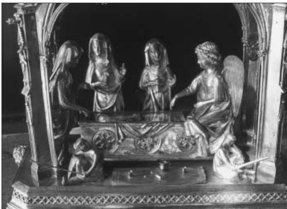
Fig . 8. Relicario del Santo Sepulcro. Composición en que se han vuelto a colocar los soldados como estuvieron antes de la restauración del siglo xx (foto autor).