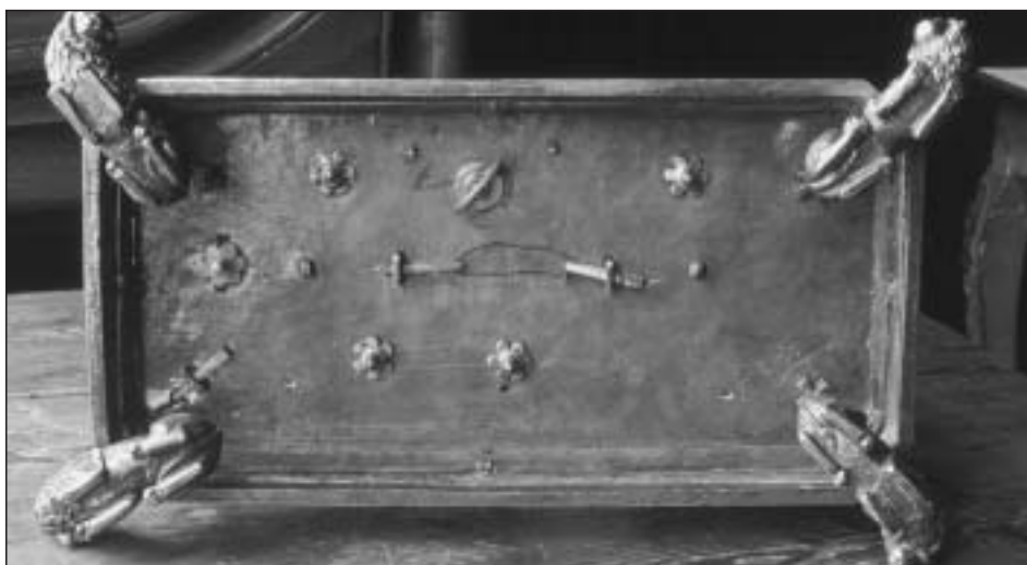
Fig. 9. Relicario del Santo Sepulcro. Vista inferior del basamento en que se aprecia el sistema de sujeción de los elementos verticales.