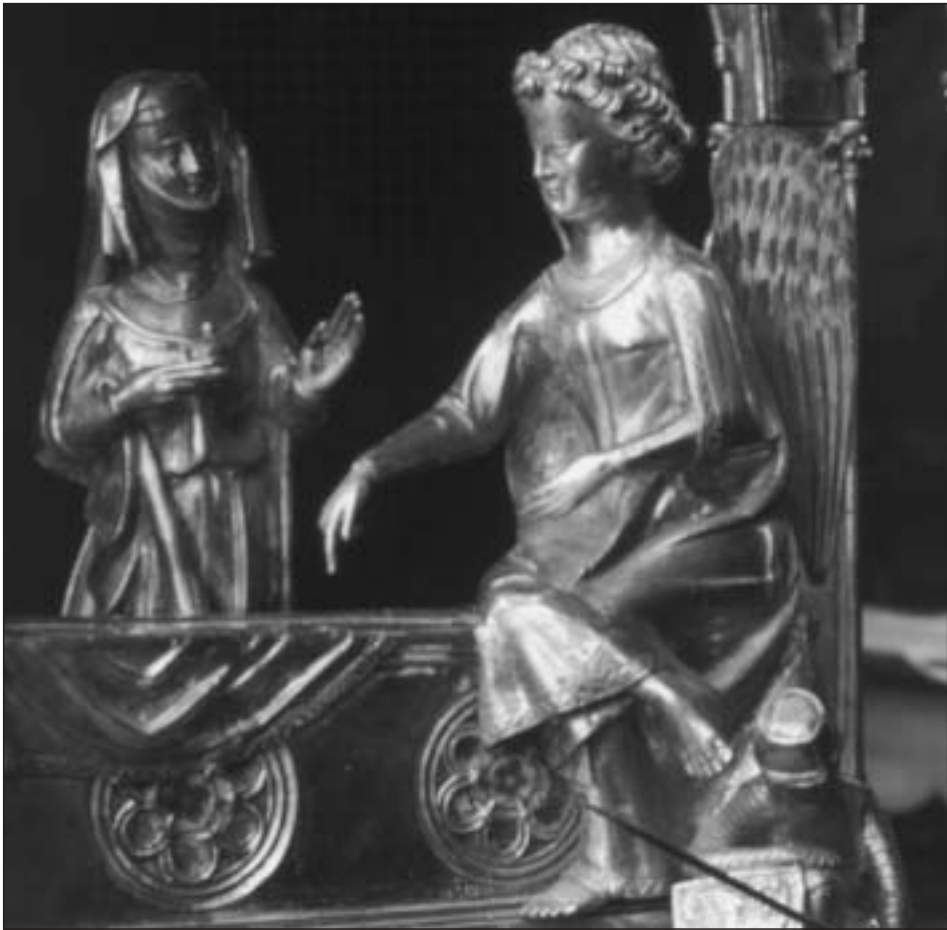
Fig. 16. Relicario del Santo Sepulcro. Detalle del ángel de la Visitatio Sepulcri.