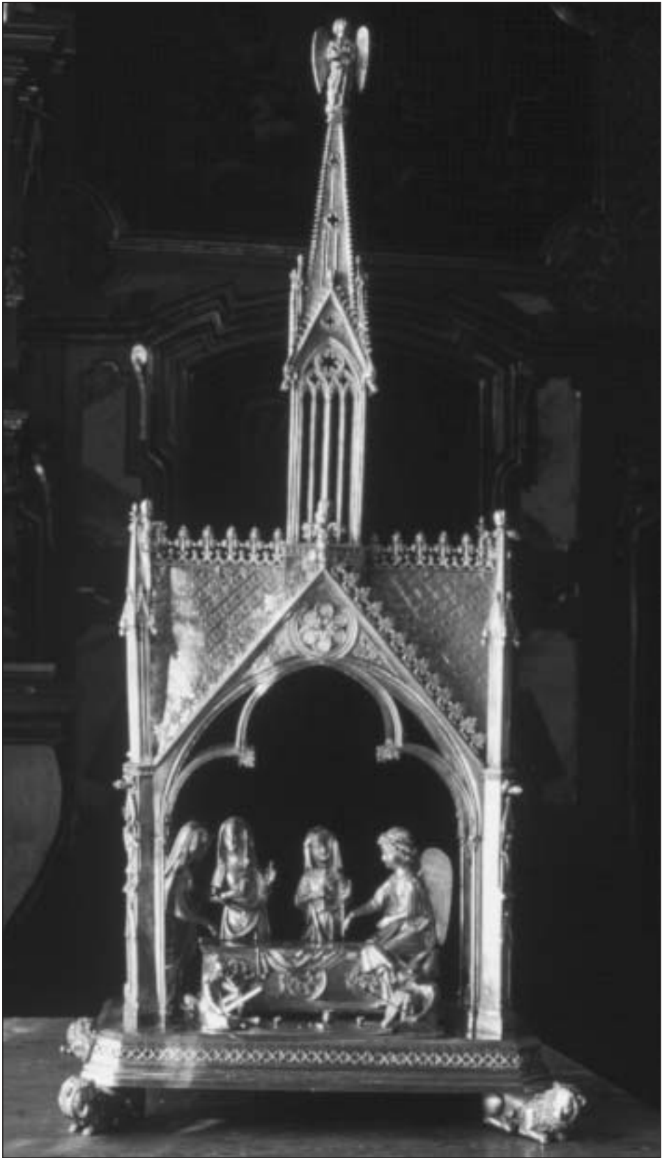
Fig. 1. Relicario del Santo Sepulcro de la Catedral de Pamplona. Estado actual.