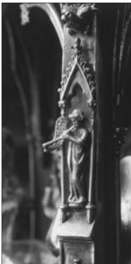
Fig. 13. Relicario del Santo Sepulcro. Detalle de ángel bajo gablete de uno de los pilares.

para la corona de espinas y otros más para cada una de las reliquias restantes), el templete pamplonés fue pensado como marco monumental de otro receptor de reliquias, en este caso el sarcófago de plata, en cuyo interior quedaron guardados el relicario menor del santo sudario, el del santo sepulcro, el de la mesa de la última cena y, ya sin receptáculos propios, cierto número de otras reliquias. La Grande Châsse se elevaba sobre cuatro leones, como el sarcófago de plata de Pamplona. La diferencia fundamental consiste en la feliz ocurrencia de desplegar una escena muy adecuada, la Visitatio Sepulcri . Del modelo parisino proceden otros detalles, como los remates de los gabletes, las gárgolas, los soportes de leoncillos, etcétera.