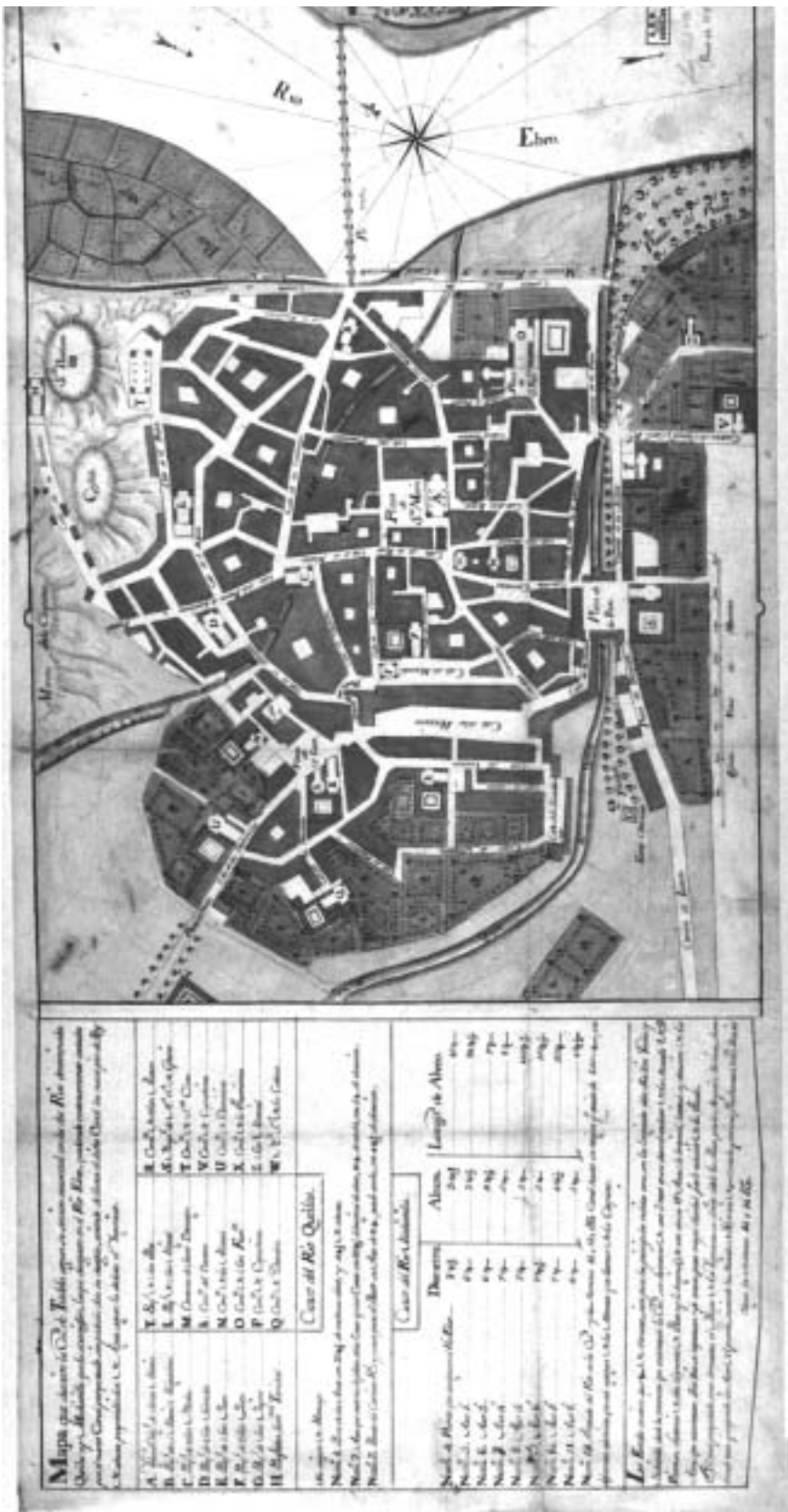
Lám. Plano de Tudela (A.H.N. Leg. 22495. Plano 784)