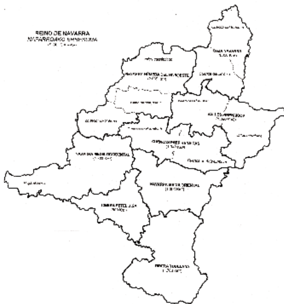
Zonificación regional del Reino de Navarra (ss. XIV-XV)