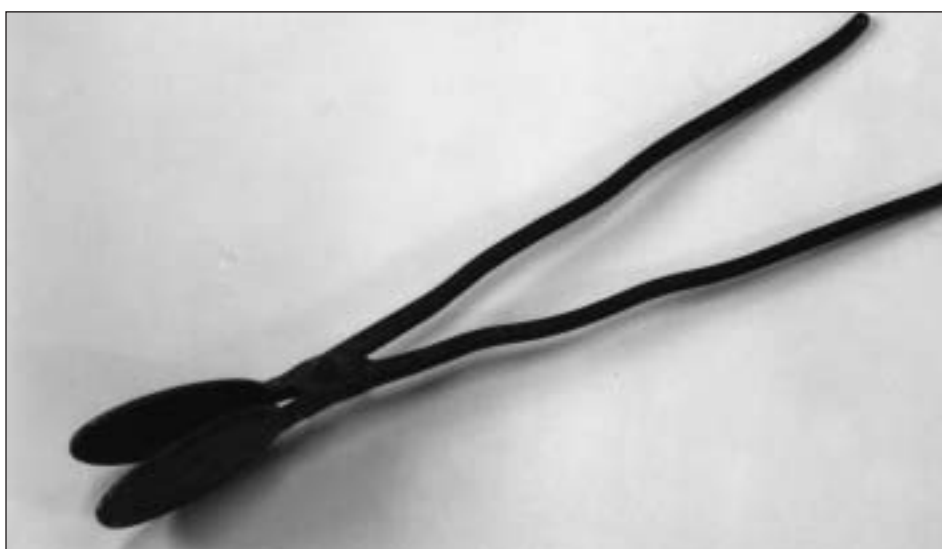
Aspecto general del "hostiario"

Realizado en hierro fundido y forjado consta de dos partes articuladas por medio de un vástago formando una tenaza o pinza. Las dos tienen la misma forma: un largo mango o brazo, de sección octogonal, que en uno de sus extremos termina en un círculo (plancha o valva) con su cara interna plana. Los brazos presentan tres suaves curvas en el tramo central, acaso con la finalidad de aumentar la presión cuando se emplease. Uno de ellos lleva fijado un anillo oval de hierro que pudo servir para cerrarlo durante su uso o para colgarlo en el momento de guardarlo.