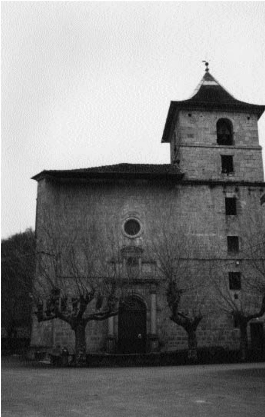
Fachada occidental de la iglesia