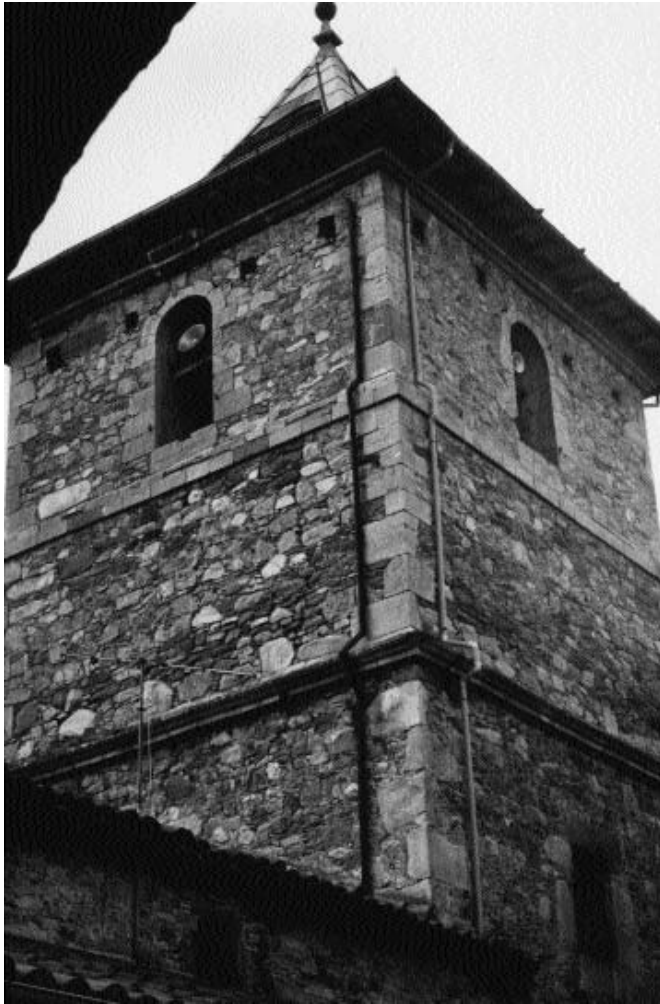
Torre, ángulo sureste