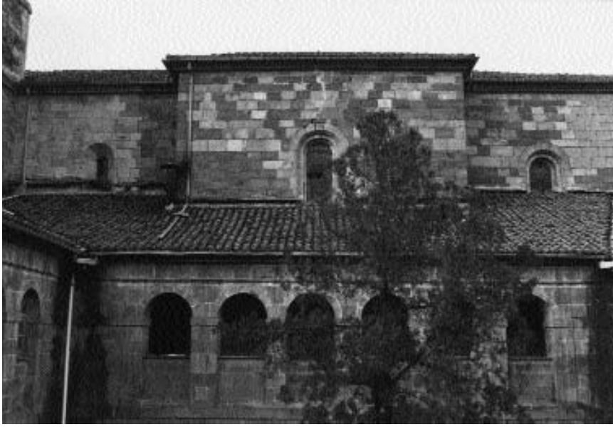
Muro sur de la iglesia y panda norte del claustro