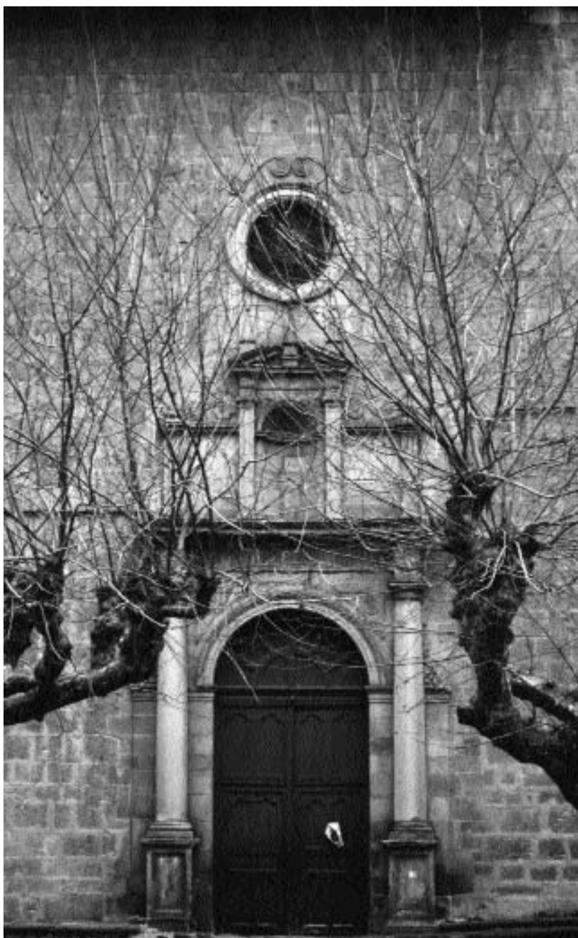
Detalle de la portada de la iglesia