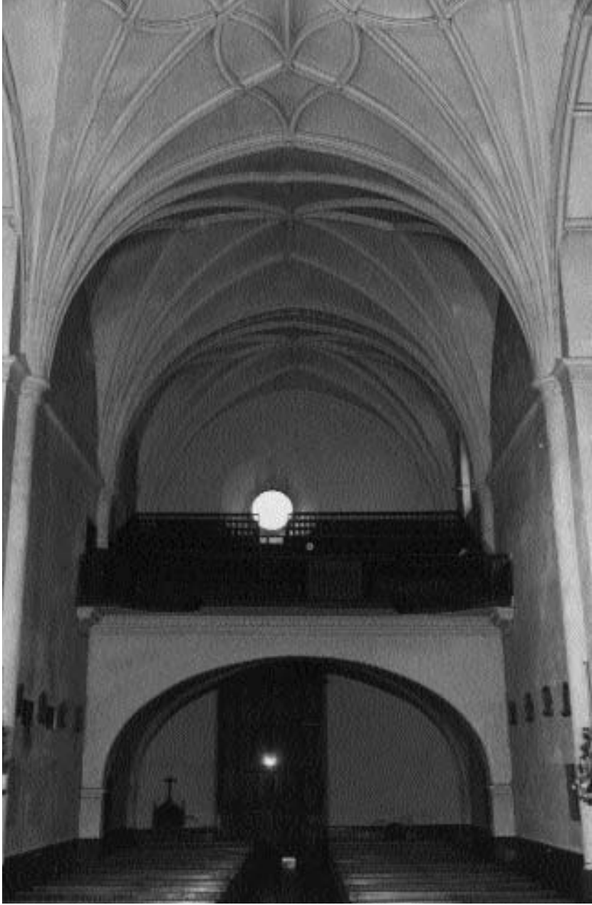
Interior de la iglesia, vista hacia los pies