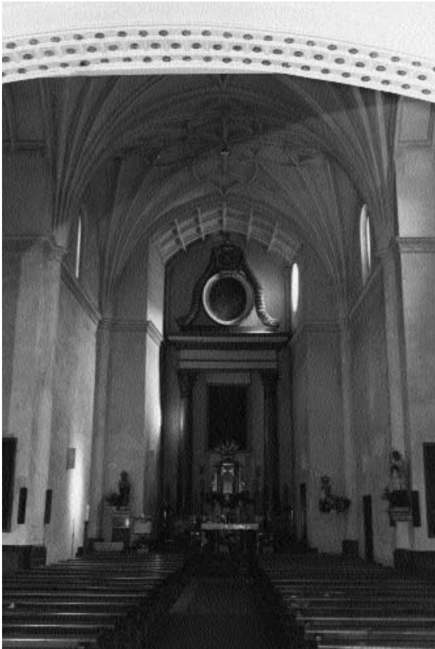
Interior de la iglesia, vista hacia la cabecera