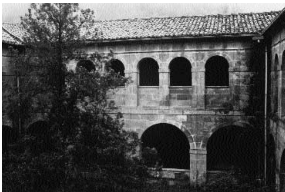
Claustro, panda sur