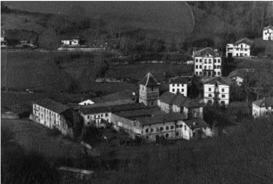
Vista general del monasterio