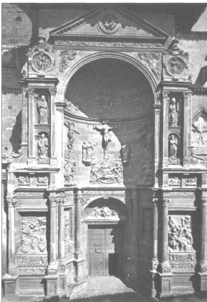
Portada principal de Santa María de Viana. Siglo XVI.