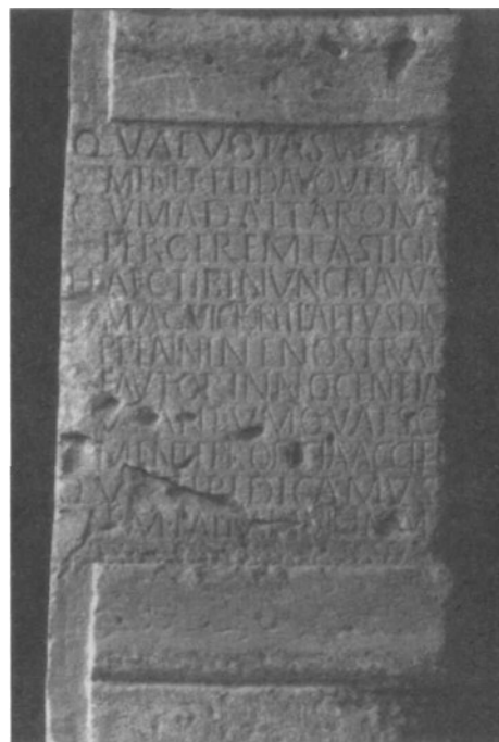
Fig. 2. Carmen de Arellano (NA).