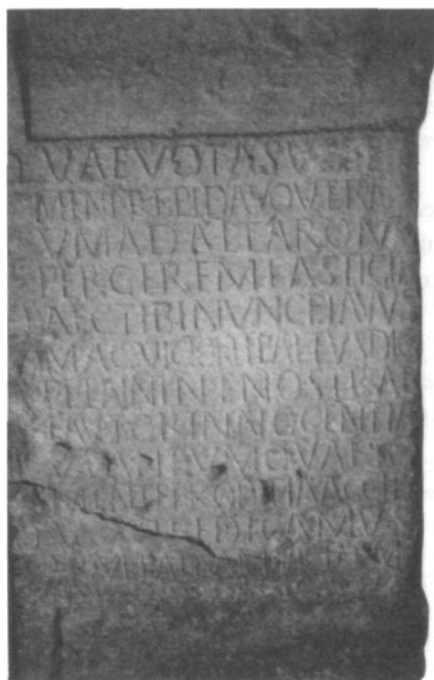
Fig. 3. Carmen de Arellano (NA).