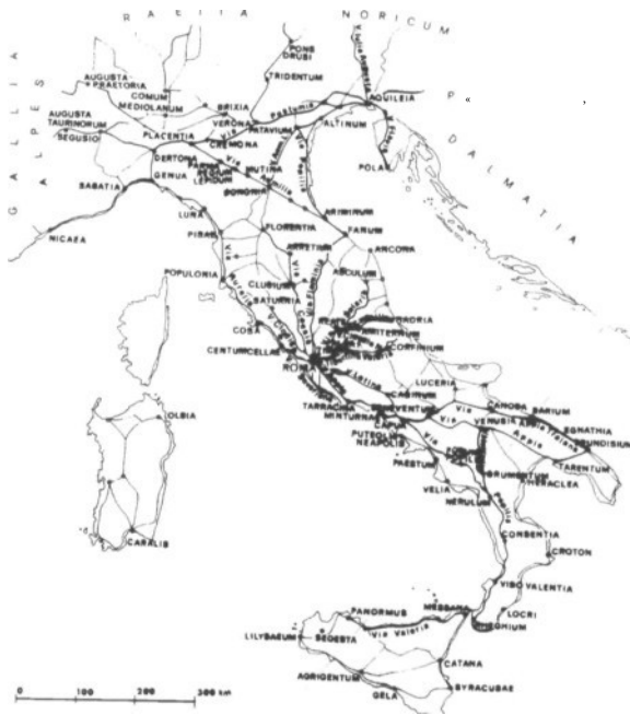
Fig. 4. Recorrido de las vías Aemilia y Flaminia (mapa de L. Quilici).