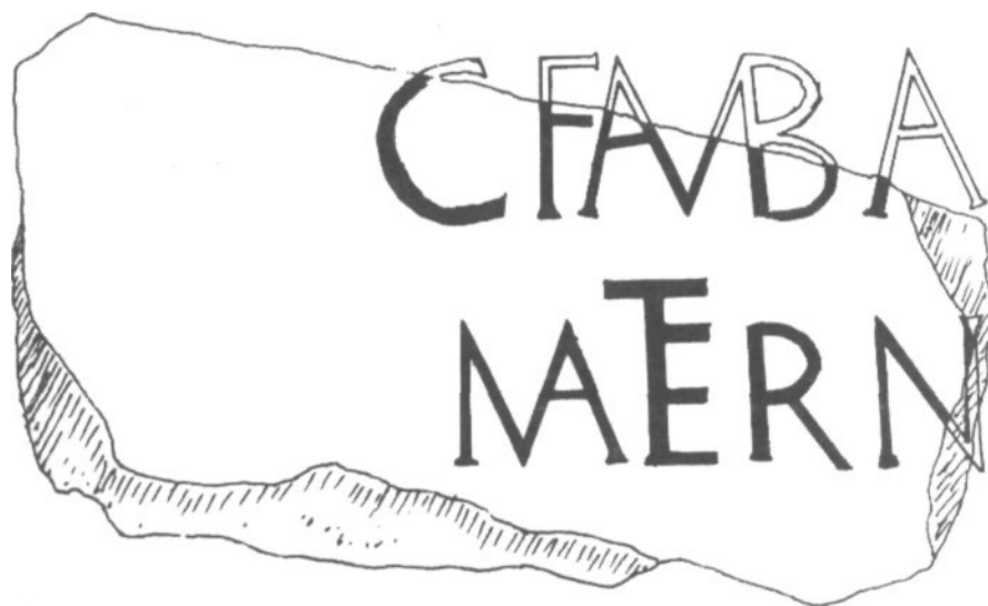
Lám. 1. Reconstrucción Foto 4.