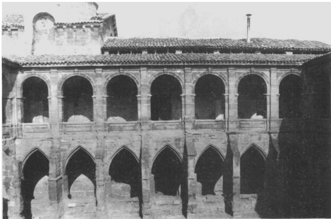
Santa María de Fitero. Crujía oriental del claustro.