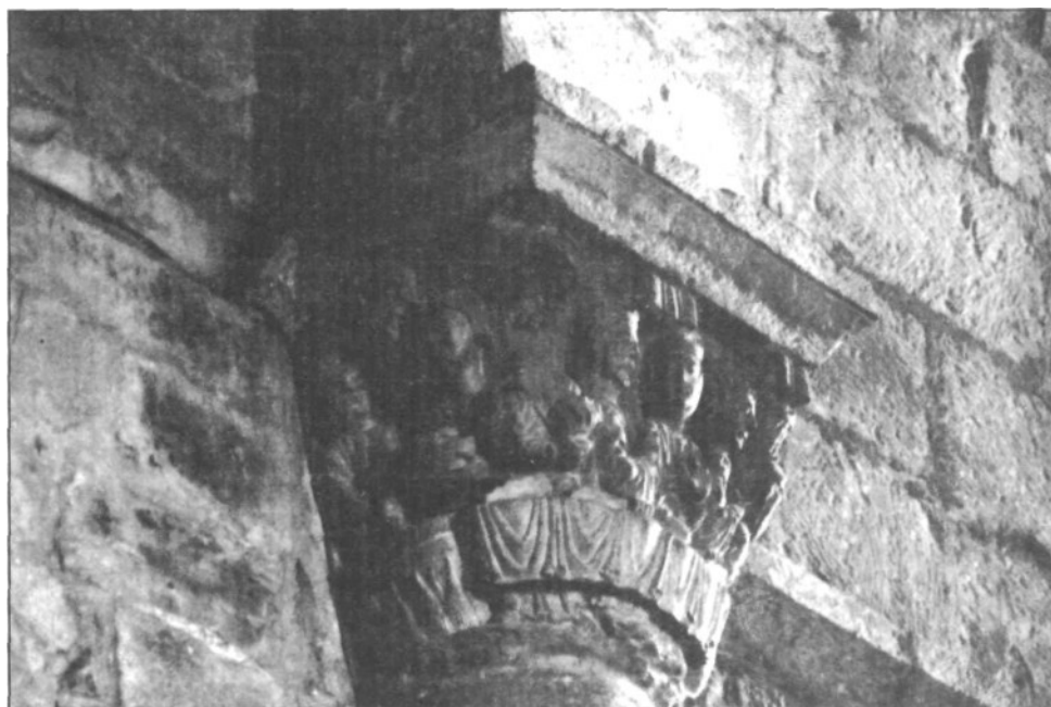
Iglesia de la Magdalena - Tudela (Navarra). Capitel muro Sur.

interior y la Puerta Norte, vemos que es en el claustro de la Catedral de Tudela -concretamente en las alas Norte y primera parte de la Este- donde se encuentra un tipo de escultura muy similar. Los caracteres generales de estilo en ambos conjuntos son los mismos si bien -como veremos- pue-