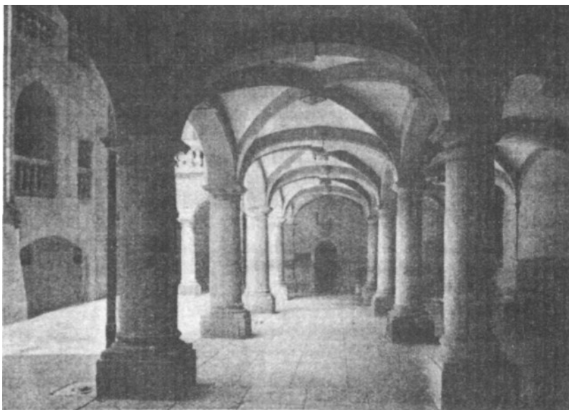
Sótanos del obispado de Ginebra y al fondo el calabozo donde fue encerrado Servet.

Esta sospecha que viene al pensamiento sobre la ilegitimidad del nacimiento de Servet se hace más consistente si consideramos que no es