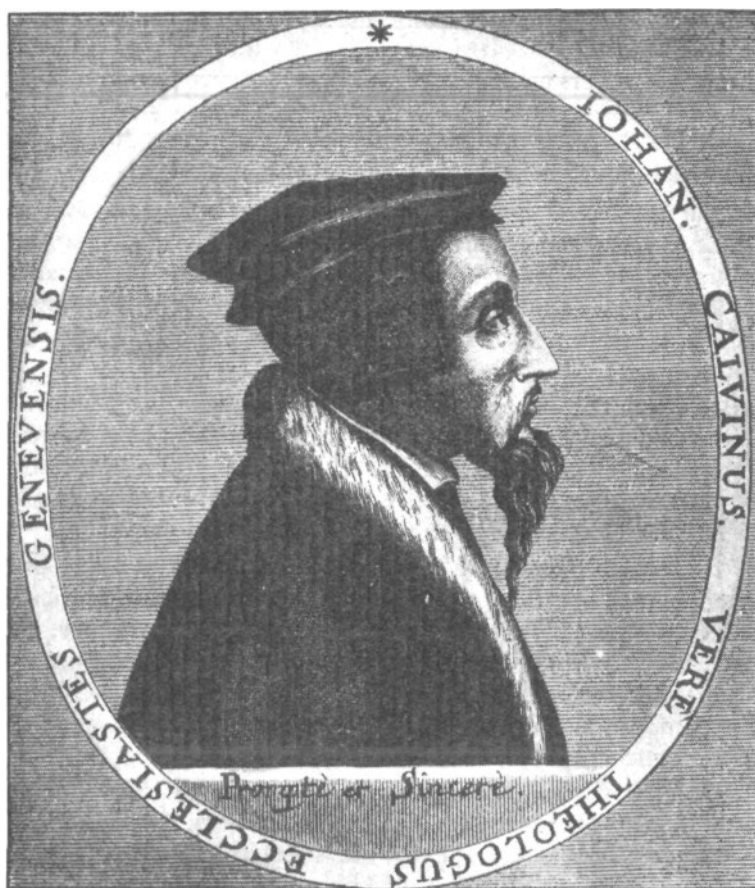
Juan Calvino. El gran enemigo de Miguel Servet nació en Noyun (Francia) en 1509 y murió en Ginebra en 1564.

un mal menor; era, simplemente, un heresiarca protestante; para los protestantes el mal era doble, porque Servet no sólo arruinaba el cristianismo, sino que justificaba en contra del protestantismo todas las acusaciones de los católicos» 32 Servet lleva la doctrina de Lutero hasta las últimas consecuencias. Los calvinistas, todavía, conservan el odio a Servet; sin embargo los católicos lo juzgan con misericordia, que en el mayor fiscal de nuestros heterodoxos, Menéndez y Pelayo y en una de sus mejores páginas de su Historia de los Heterodoxos Españoles se comprueba con toda evidencia.