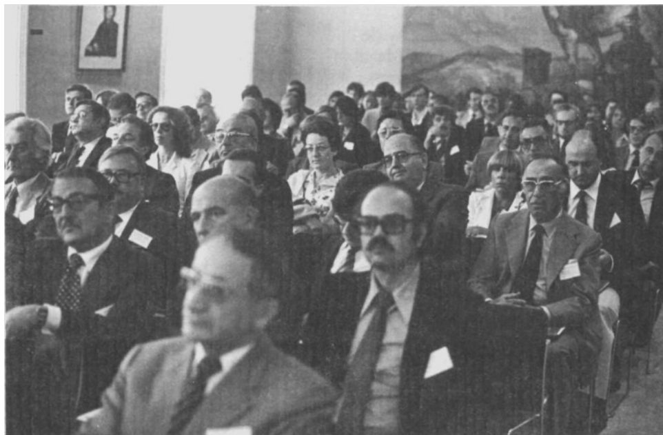
Asistentes a la V Reunión de Editores Universitarios y Científicos de Europa, en el Salón de Actos del Museo de Navarra.

(2) Se incluye en este número de «Príncipe de Viana» el texto de la ponencia.