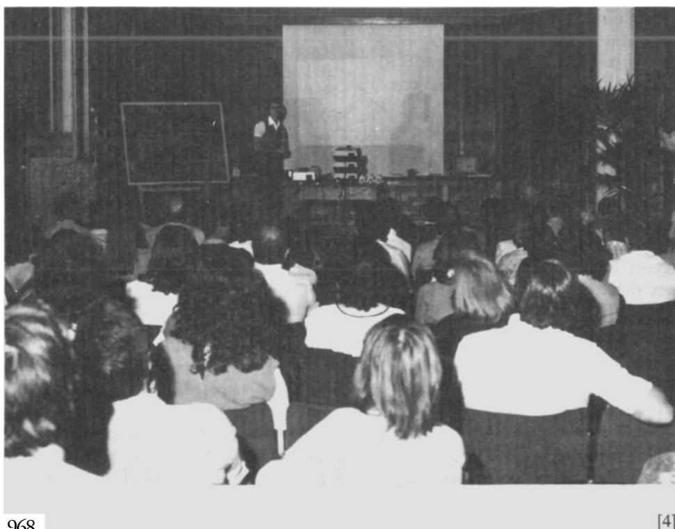
Curso de Didáctica del Color, en el Museo de Navarra.

Dentro de esta misma línea de actuación se mantuvieron los conciertos de la «Semana de Música Antigua de Estella», el