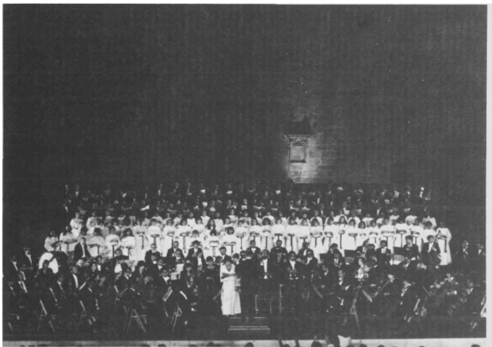
1 Orfeón Pamplonés junto a la Orquesta Filarmónica de Kosice la noche de la Novena Sinfonía, en los Festivales de Olite.

concurrancia masiva convertidos en auténtica fiesta, rompiendo la vieja idea de la cultura que hasta ahora se ha intentado esparcir, responde, sin duda, a una determinada concepción de la sociedad. Por todo ello nos encontramos que hemos padecido una cultura: clasista, homogénea, impuesta y patrimonial.