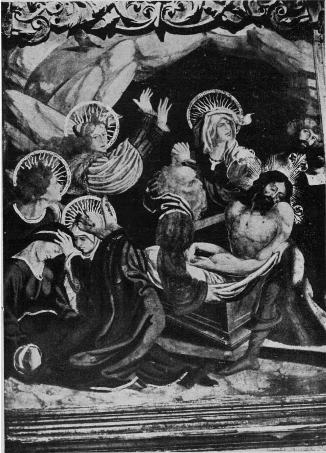
«Jesús en el Sepulcro», pintura del retablo del altar mayor de Cizur Mayor, restaurado