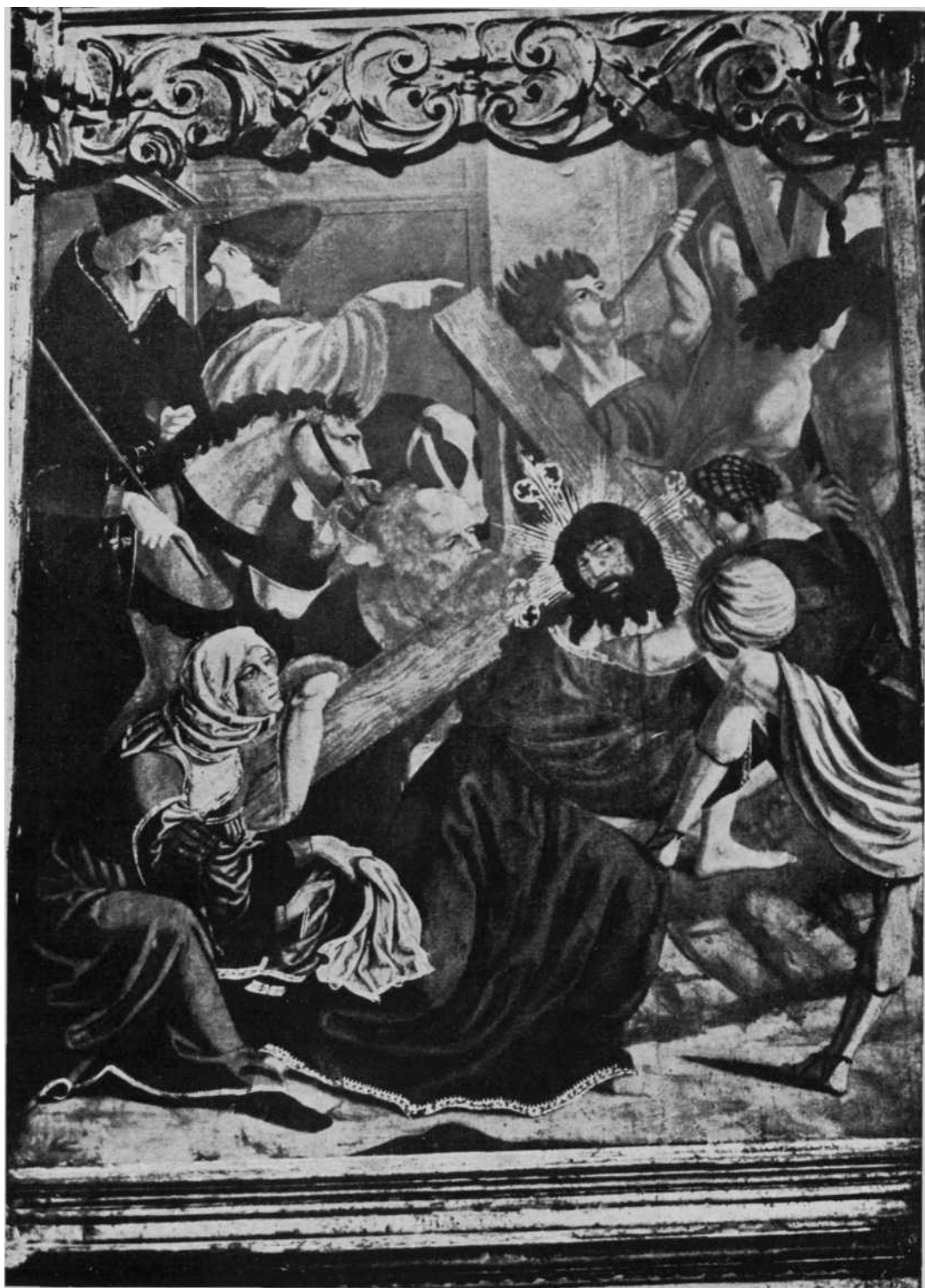
«La Cruz a cuestras», pintura del retablo del altar mayor de Cizur Mayor, restaurado