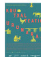
KRUTXALTEATIK URONARAT Marina Lameiro Habitantes de Uztárroz / Uztarrozko biztanleak / Neighbors of Uztarroz