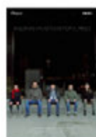
BALLENAS APLASTADAS POR EL HIELO Andrea Jaurrieta