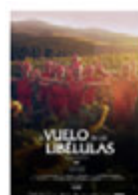
EL VUELO DE LAS LIBÉLULAS Iñaki Alforja