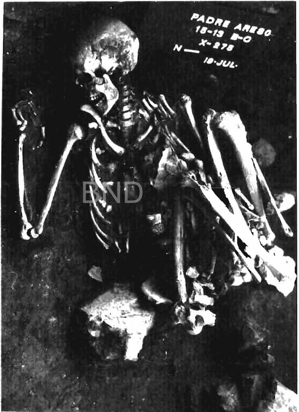
LAMINA II.-Vista del enterramiento n.º II en posición fetal.