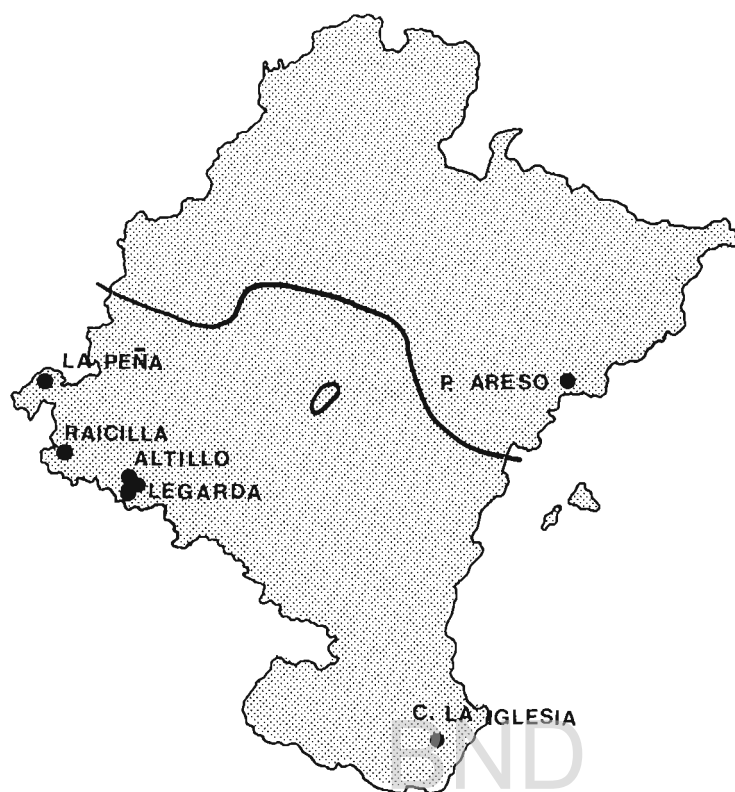
Figura 1.—Localización geográfica de los yacimientos citados en el texto.

acabado como en la calidad de pasta y forma, con varios fragmentos encontrados en el mismo cuadro entre -207 y -240 de profundidad, niveles II y III respectivamente. Este dato puede confirmar que los autores del enterramiento fueron los ocupantes del nivel II.