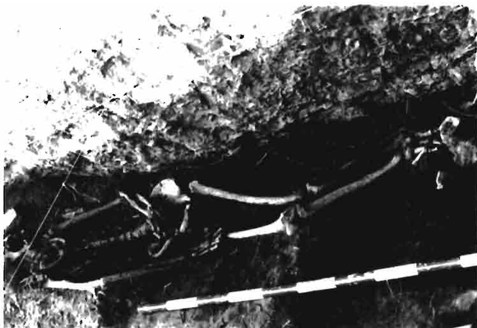
LAMINA I.-Diferentes aspectos del enterramiento n.º I de «Padre Areso».