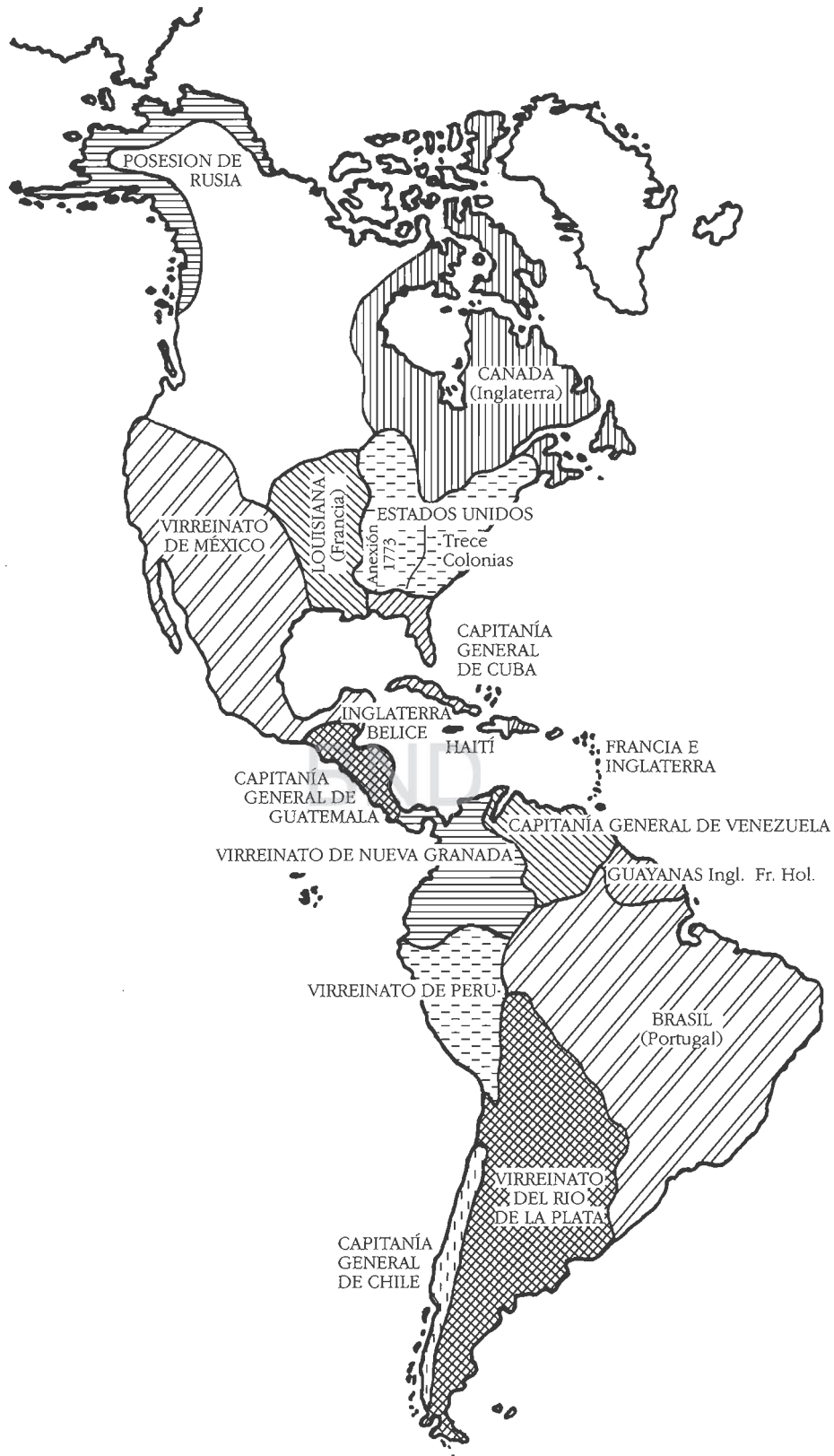
DIVISION POLITICA DEL TERRITORIO AMERICANO A PRINCIPIOS DEL SIGLO XIX.