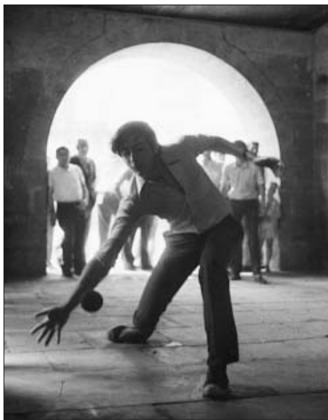
El escaso bote de la pelota obliga al pashakalari a agacharse continuamente