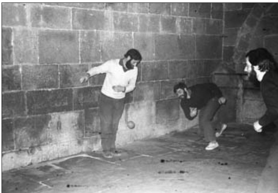
Con posturas forzadas es más difícil un buen control del envío de la pelota al campo contrario