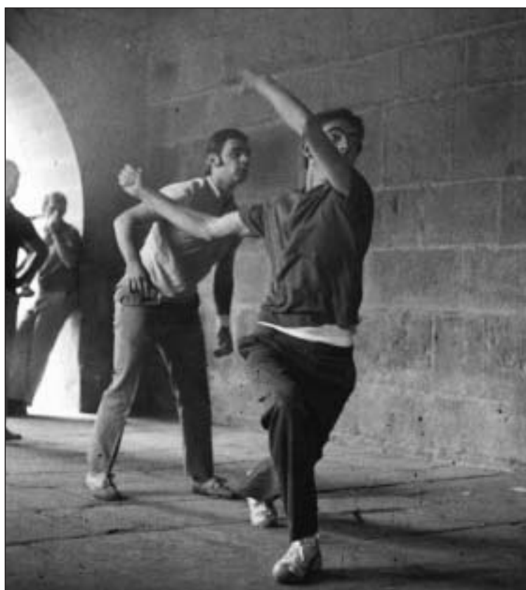
Cortar un evío al aire permite imprimir más fuerza y una mejor colocación de la pelota devuelta con apuros y sin violencia