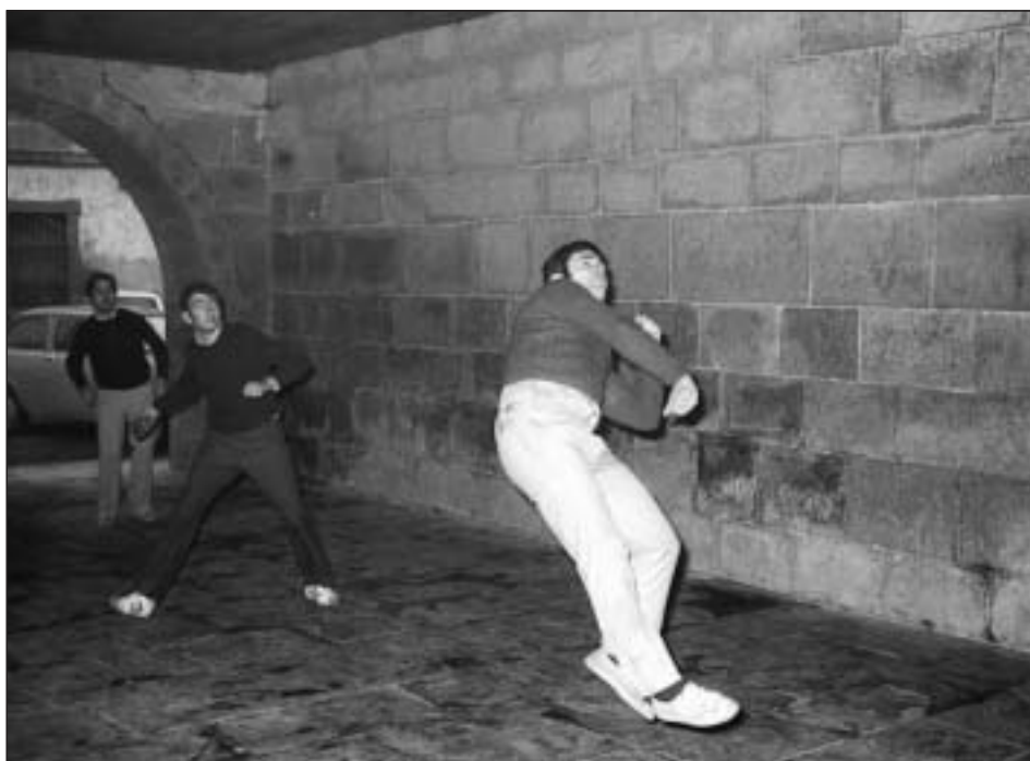
Entrar al aire en el ataque exige un notable esfuerzo por el peso de la pelota