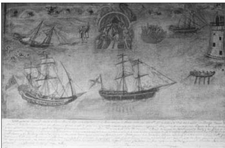
Exvoto con varias embarcaciones en el santuario de la Virgen del Camino. Muros, A Coruña