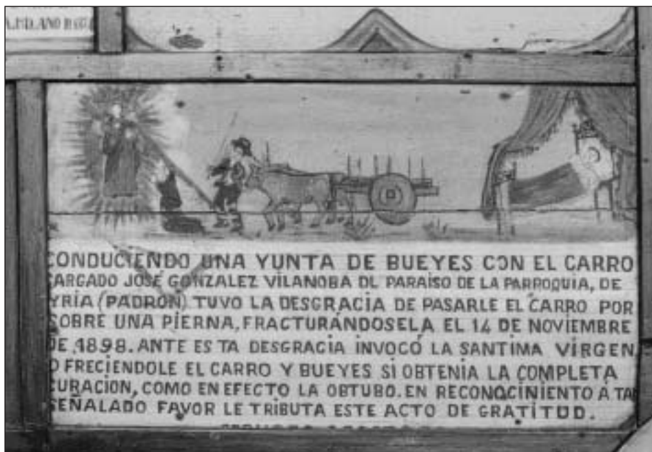
Exvoto con cama bajo cortinones y carro del país en el santuario de la Esclavitud. Padrón, A Coruña