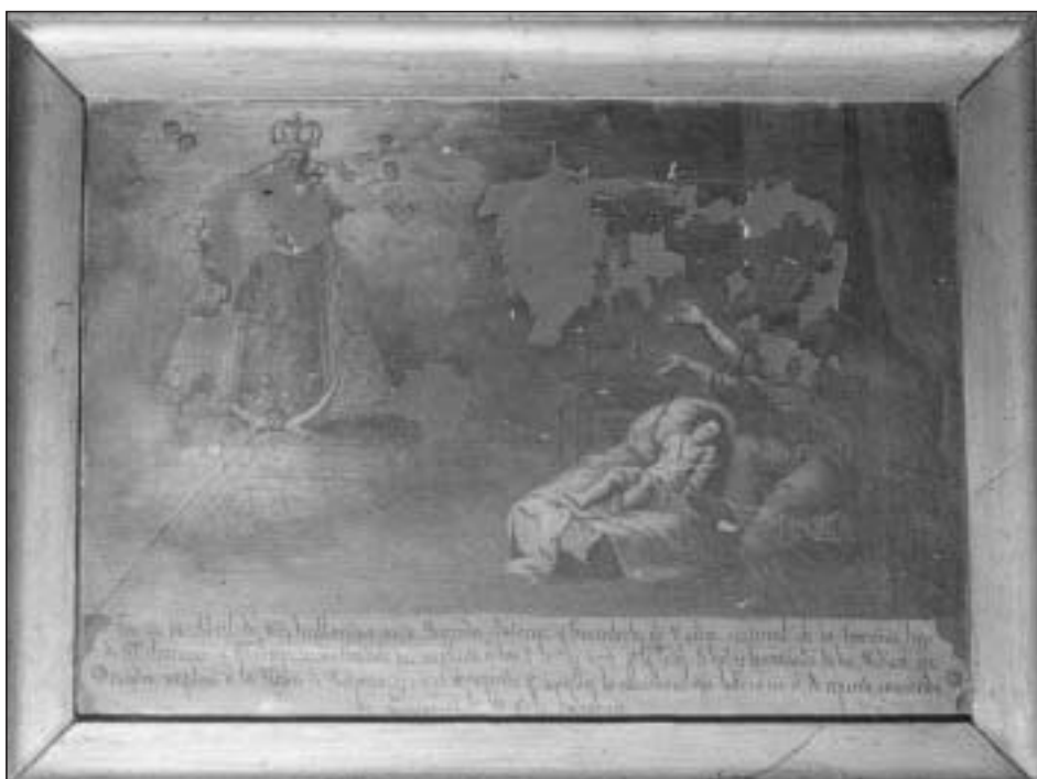
Exvoto muy deteriorado en el santuario de Pastoriza. Arteixo, A Coruña