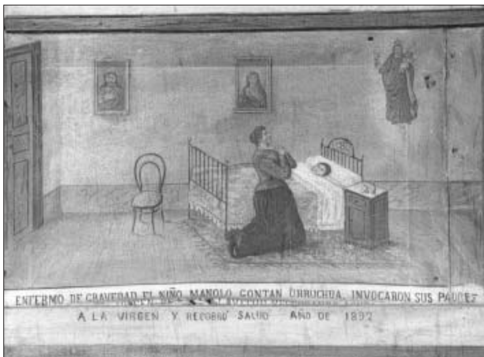
Exvoto con cama y silla de forja y cuadros en el santuario de la Esclavitud. Padrón, A Coruña