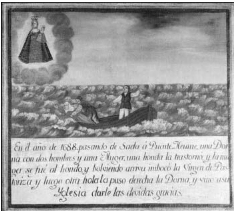
Exvoto con una “dorma” en el santuario de Pastoriza. Arteixo, A Coruña