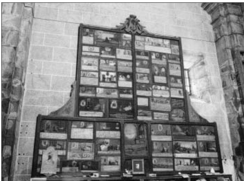
Retablo con exvotos en el santuario de la Esclavitud. Padrón, A Coruña