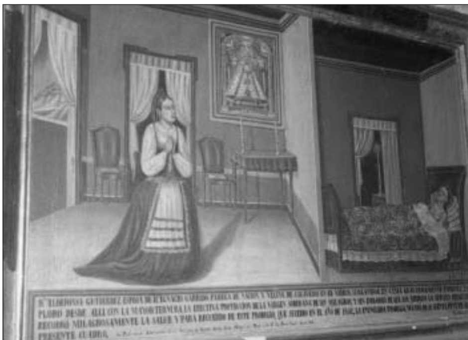
Exvoto con cama, sillas, mesa y cuadro en el santuario de los Milagros del Monte Medo. Baños de Molgas, Ourense