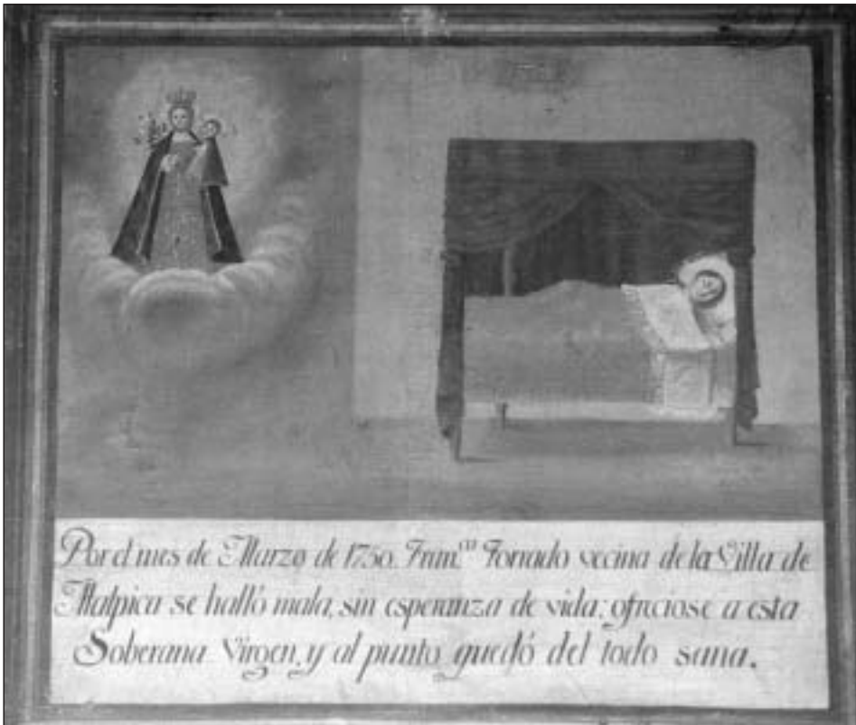
Exvoto con cama bajo dosel en el santuario de Pastoriza. Arteixo, A Coruña.