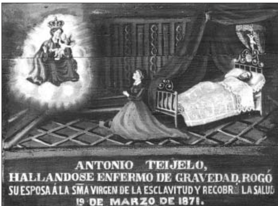
Exvoto con cama de forja en el santuario de la Esclavitud. Padrón, A Coruña. (Archivo Gráfico del Museo de Pontevedra)