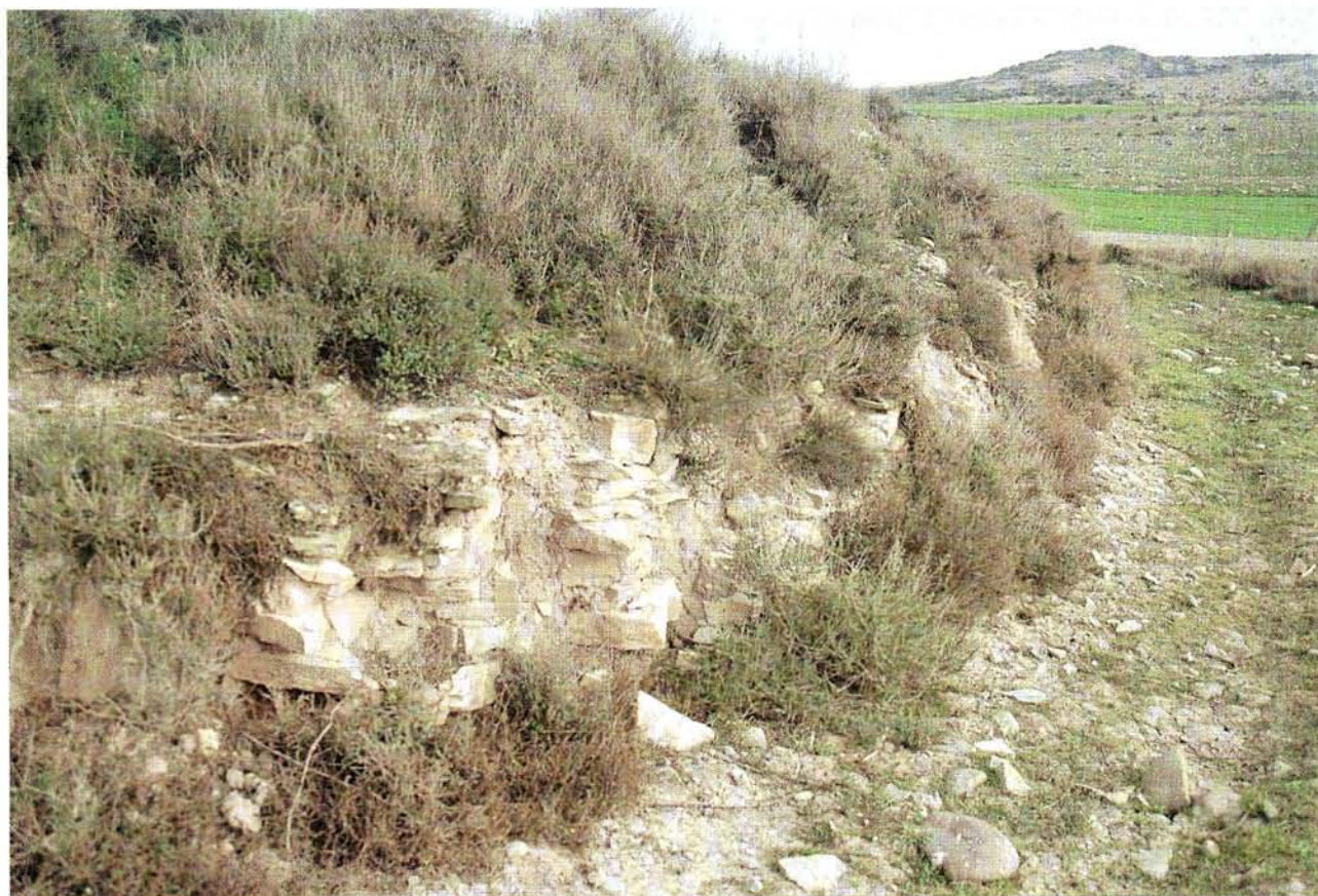
Diapositiva Yacimiento del «Cogote Hueco» (Mendavia, Navarra).