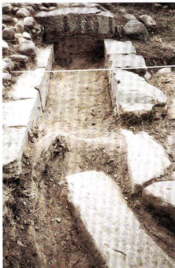
Fotografía Yacimiento de «la Calera» (Mendavia, Navarra).