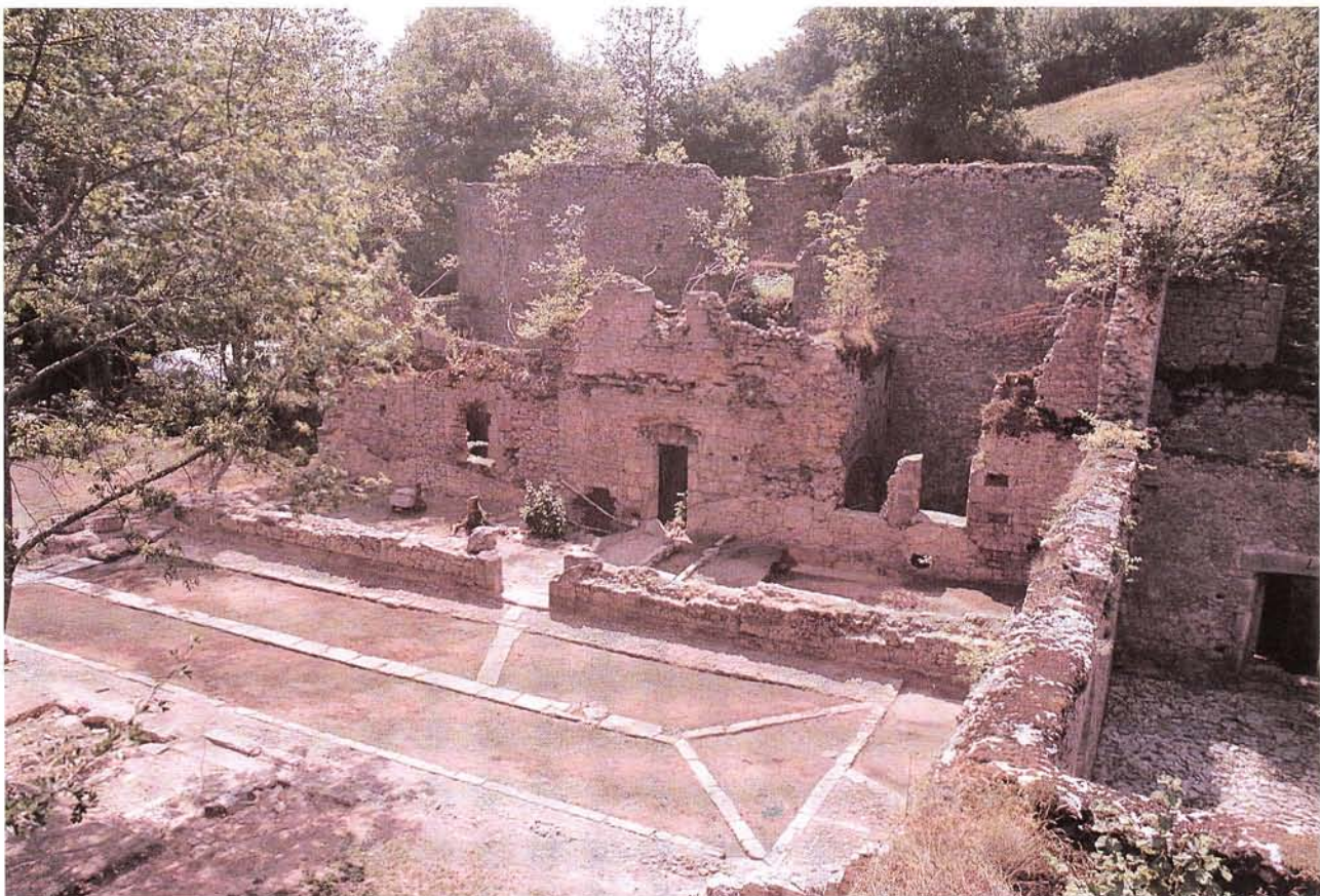
Foto 4 Talleres de reconocimiento de municiones.