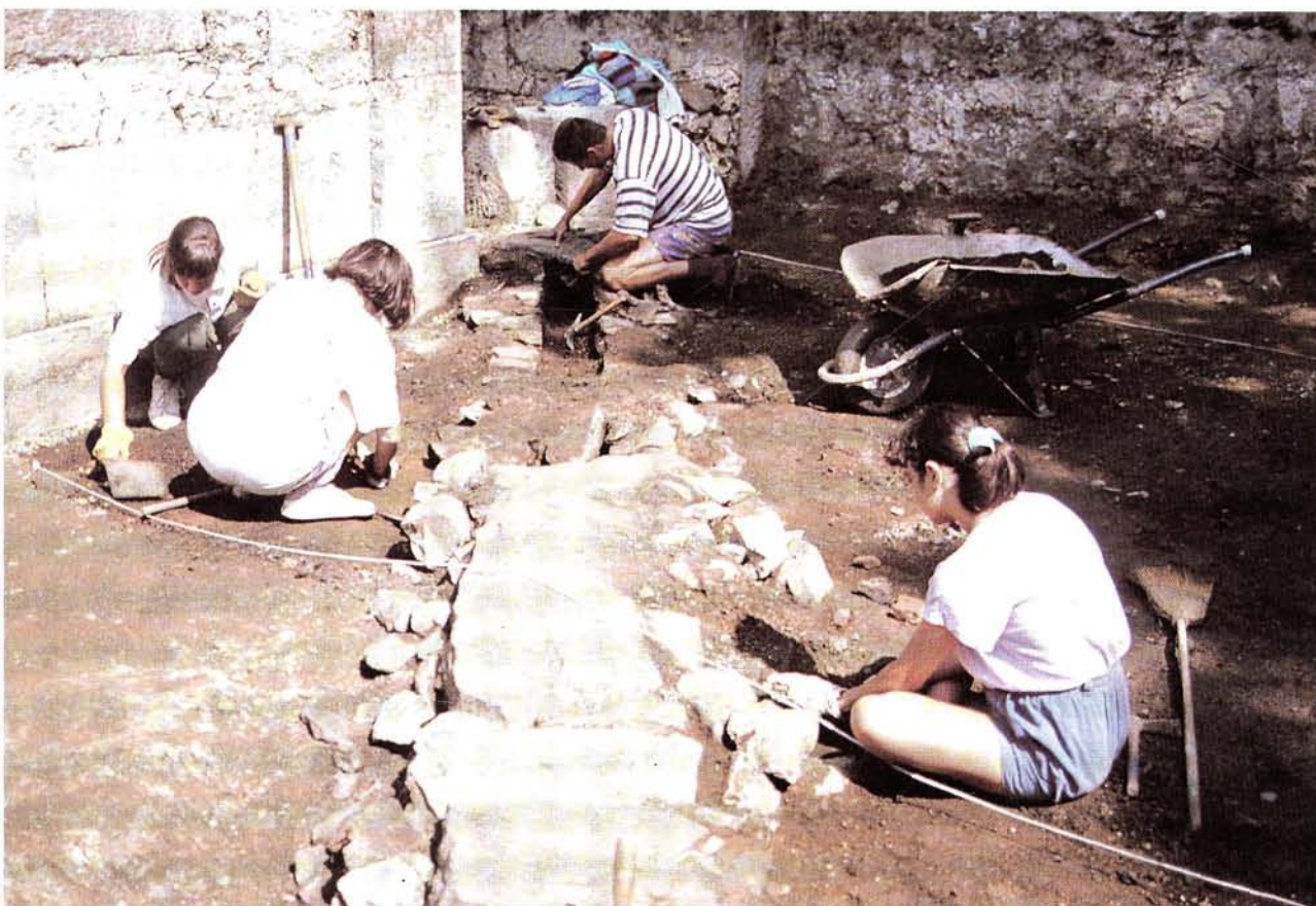
Foto 2 Canalización del acceso de Aézcoa.