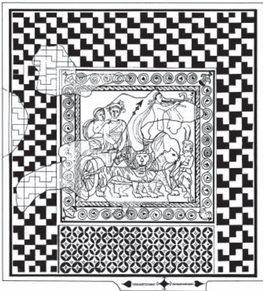
Lámina 3. Pavimento de opus tessellatum . Reconstrucción del emblemata