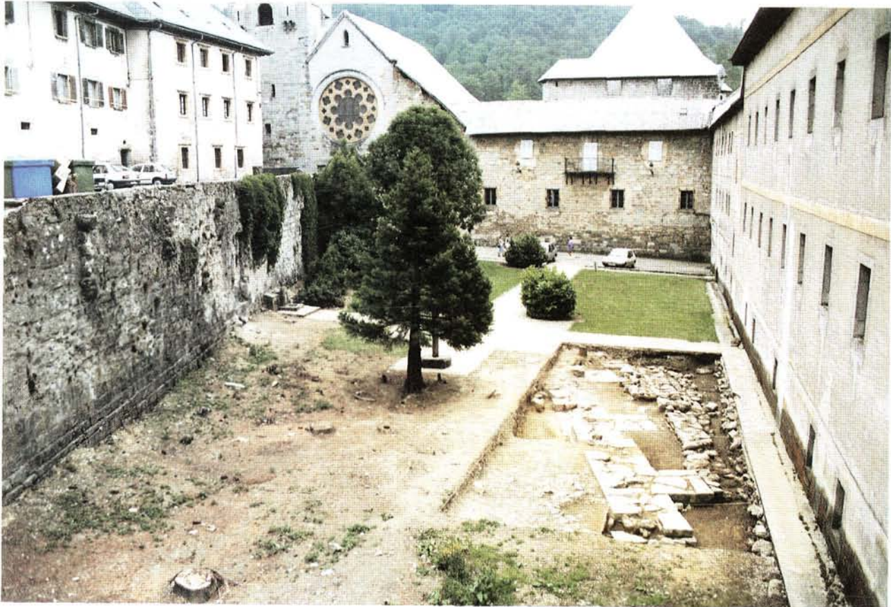
Foto 1 Vista general del Sector B.