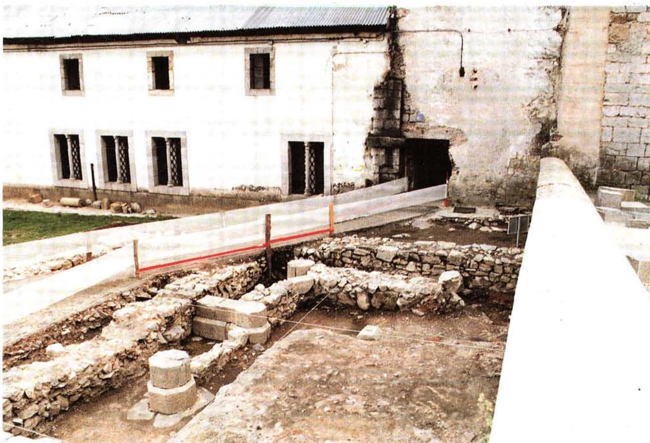
Foto 4 Detalle de los apoyos octogonales del Sector C.