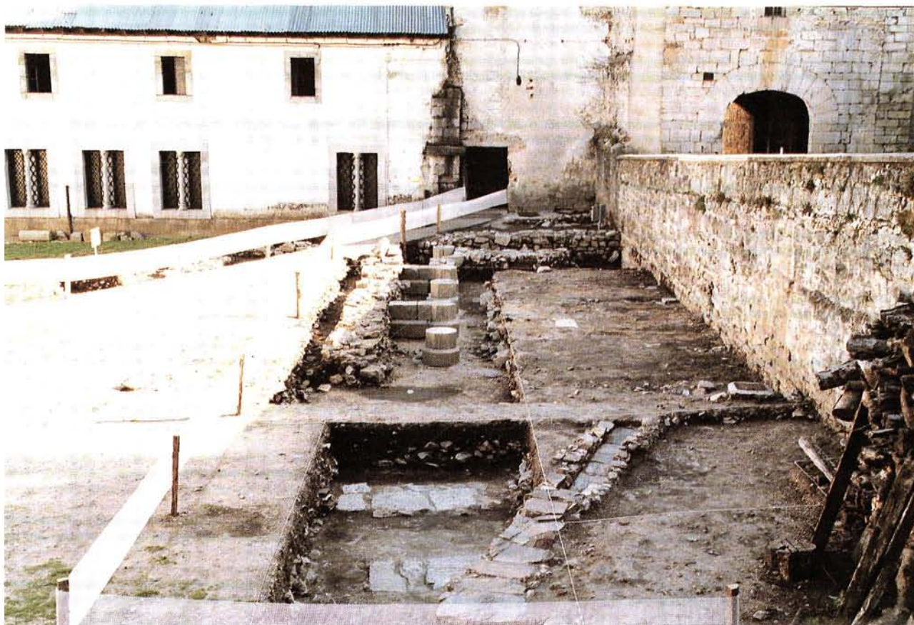
Foto 3 Vista parcial del Sector C.