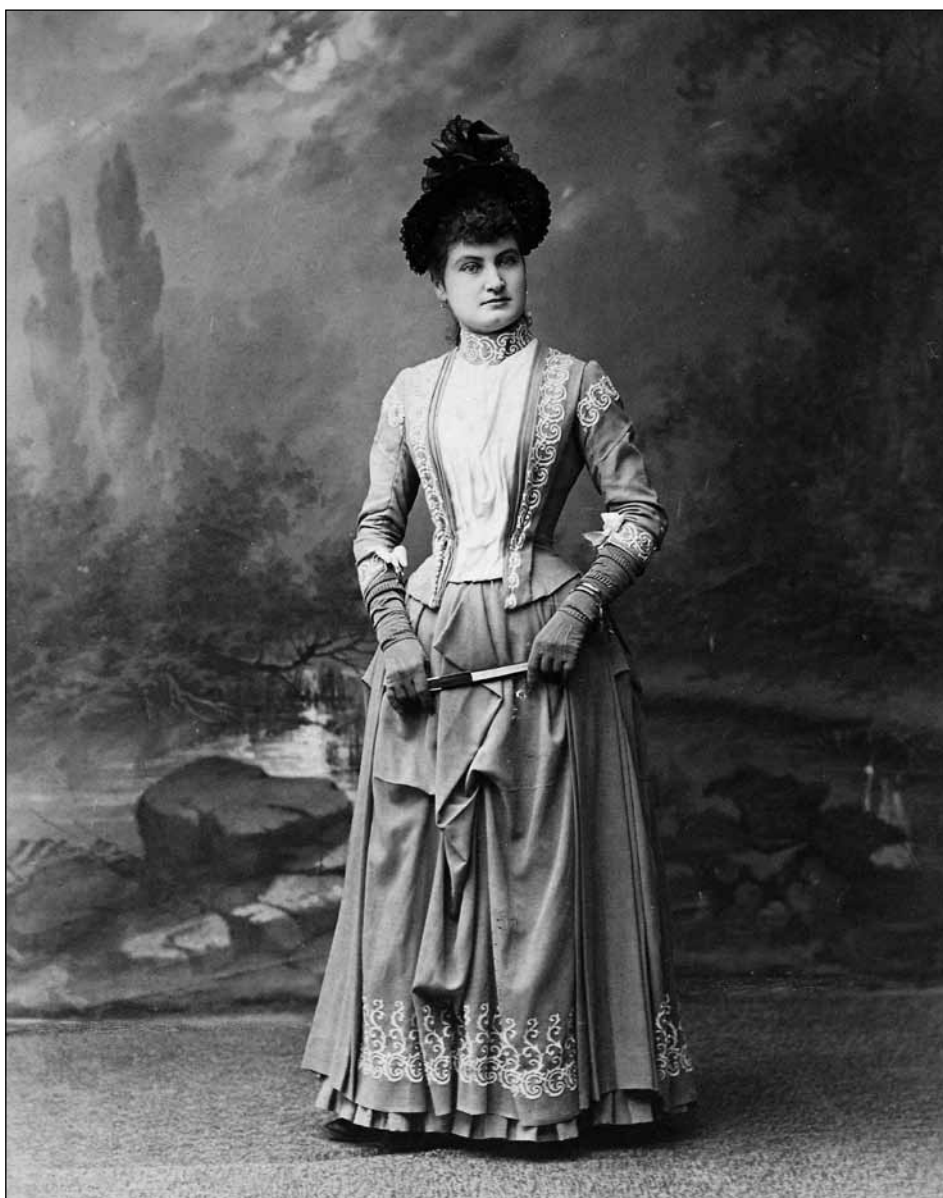
Figura 8. Emilio Pliego. Retrato de mujer (c. 1885). Papel a la albúmina. 21,7x16,3. (AMP).

Emilio Pliego trabajó con todo el abanico de técnicas y de formatos que ofrecía la fotografía en cada momento. Sus cartes que van desde la mignon a la boudoir están realizadas en papel a la albúmina con y sin esmaltado, con colodión y gelatina de ennegrecimiento directo, con colodión mate virado al oro platino, con platino y con gelatina de revelado químico.