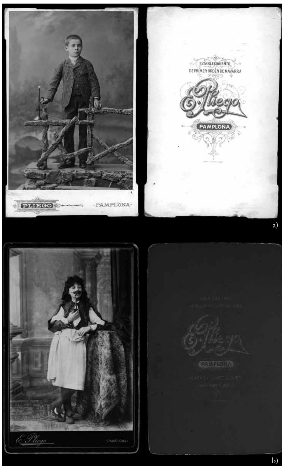
Figura 9. a) Emilio Pliego. Retrato de niño en formato carte de cabinet (c. 1900). Papel a la albúmina. 16,5x10,5 cm; b) Emilio Pliego. Retrato de niña disfrazada en formato carte de cabinet (c. 1900). Papel a la albúmina 16,7x10,8 cm; c) Emilio Pliego. Retrato de hombre en formato carte mignon (c. 1900). Gelatina o colodión de ennegrecimiento directo. 8,8x4,8 cm. (AMP).