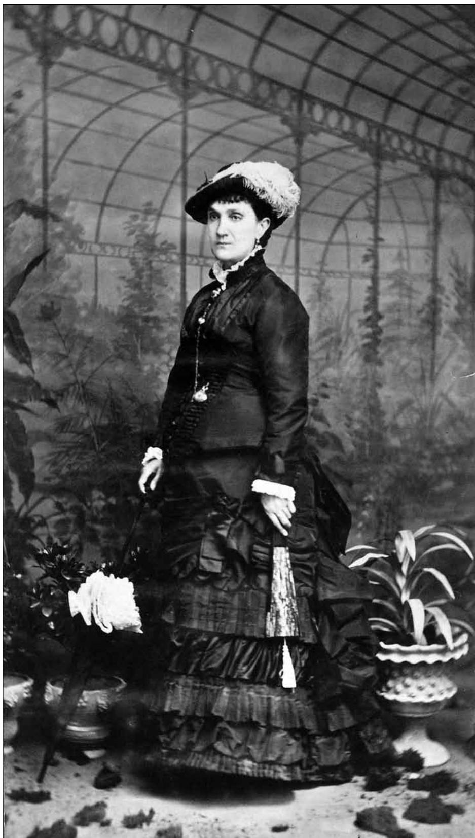
Figura 6. Agustín Zaragüeta. Retrato de mujer, en formato carte de promenade (c. 1885). Papel a la albúmina. 18,9x9,4 cm. (AMP).