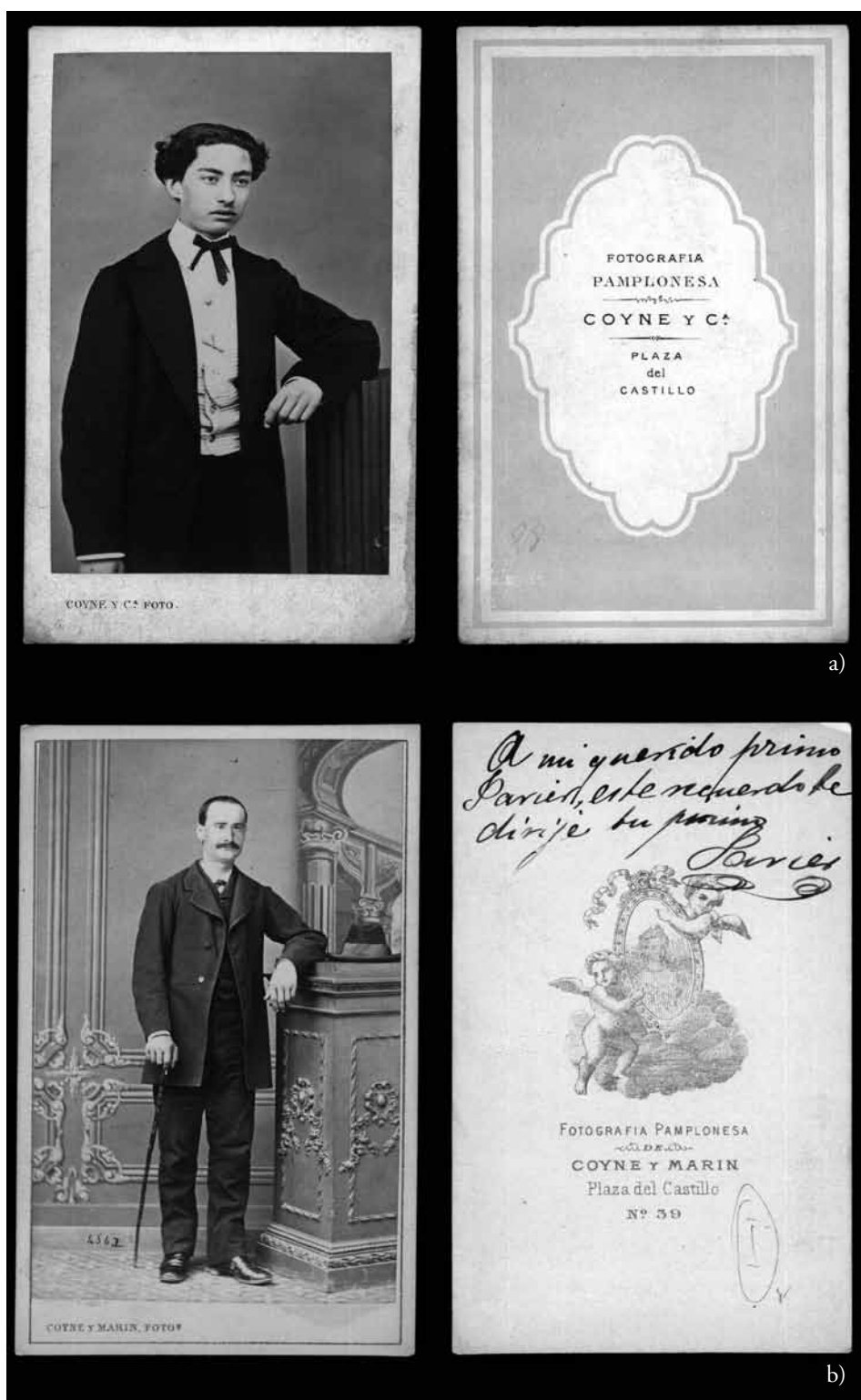
Figura 4. a) Coyne y Cía. Retrato de hombre en formato carte de visite (c. 1870). Papel a la albúmina a partir de negativo de colodión húmedo. 10,6x6,3 cm.; b) Coyne y Marín. Retrato de hombre en formato carte de visite (c. 1875). Papel a la albúmina a partir de negativo de colodión húmedo. 10,5x6,3 cm.; c) Marín y Coyne. Retrato de hombre en formato carte de cabinet (c. 1870). Papel a la albúmina esmaltada a partir de negativo de colodión húmedo. 16,4x10,8 cm. (AMP).