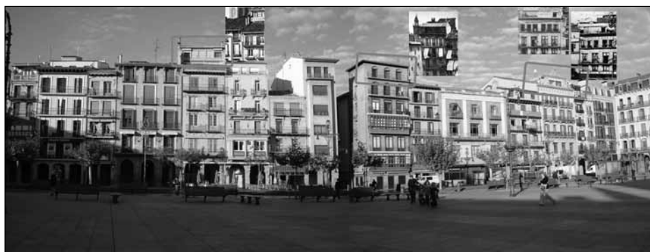
Figura 2. Panorámica de la plaza del Castillo. Localización de los establecimientos fotográficos del frente este.

Para mayor abundamiento, la plaza conformaba uno de los espacios más amplios en un entramado urbano de estrechas calles y belenas, con lo que los edificios allí emplazados recibían una abundante iluminación, una condición, como ya hemos señalado, idónea y necesaria para los negocios de fotografía, puesto que las tomas se realizaban todas con luz natural ya que el alumbrado público no empieza a instalarse en las ciudades hasta entrada la década de los 80. Por eso, la plaza concentra el mayor número de establecimientos fotográficos de toda la ciudad, hasta un total de ocho que fueron reaprovechados por sucesivos fotógrafos, una práctica que era muy habitual, puesto que las estructuras que conformaban los lucernarios eran costosas y solo se podían emplear para este tipo concreto de negocios. Incluso, el recuerdo de estas estructuras permanece hoy patente en aquellos edificios que en algún momento acogieron un estudio fotográfico en el piso superior, presentando una altura más de las que tenían en origen (fig. 2). A estos estudios fotográficos hay que sumar, además, dos comercios de la plaza de la Constitución que habían puesto a la venta productos relacionados con la fotografía.