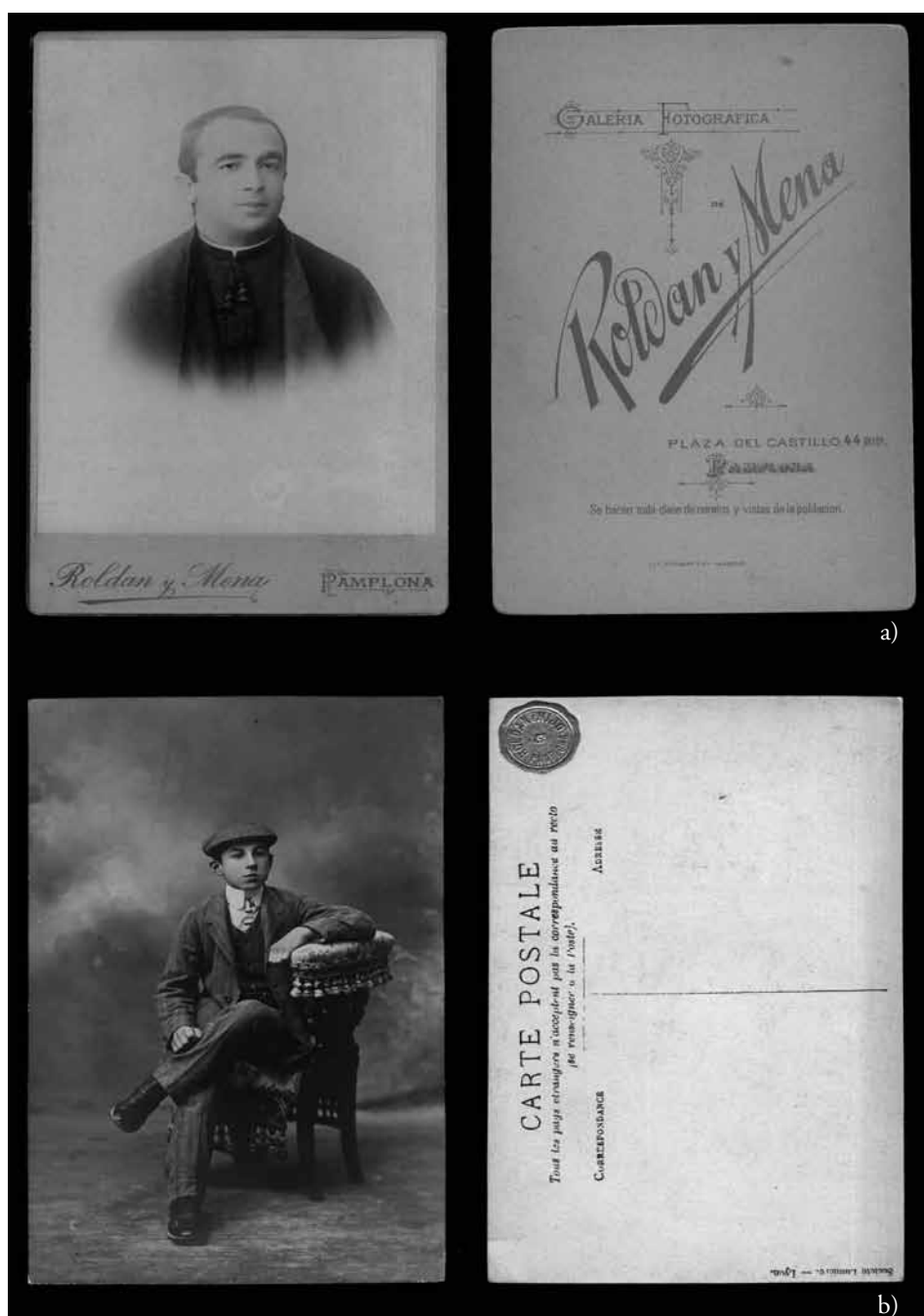
Figura 10. a) Roldán y Mena. Retrato de eclesiástico en formato carte de cabinet (c. 1890). Papel a la albúmina. 16,6x10,6 cm.; b) Roldán e hijo. Retrato de joven en formato tarjeta postal (c. 1905). Colodión mate virado al oro platino. 13,8x8,7 cm.

al retratado (fig. 10b). Por tanto, los retratos que José Roldán realizó se concentran, principalmente, en el personaje, eliminando elementos accesorios o anecdóticos. Coincidiendo con la producción de Pliego, hay una preferencia por el uso de escenografías en el caso de los retratos infantiles, más difíciles de abordar, y en los que la naturalidad resultaba más complicada de conseguir. Por otro lado, esta etapa de la vida es la que se identifica más con el mundo de fantasía que representaban esos escenarios virtuales.