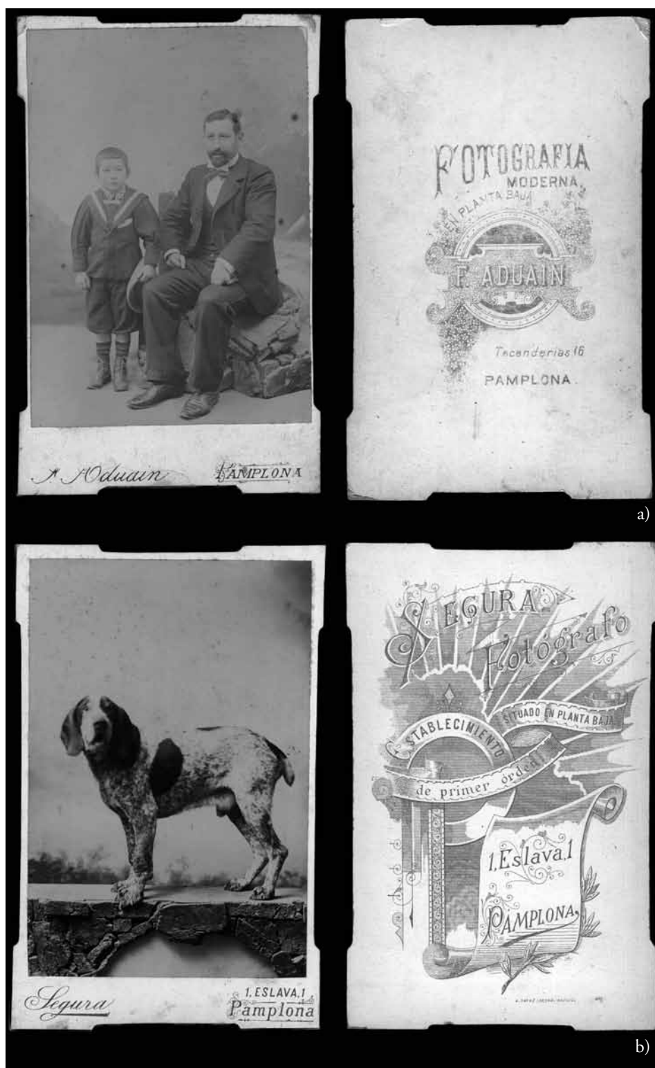
Figura 11. a) Fermín Aduain. Retrato de padre y su hijo en formato carte de cabinet (c. 1900). Gelatina o colodión de ennegrecimiento directo. 16,6x10,5 cm.; b) Eugenio Segura. Retrato de perro en formato carte de cabinet (c. 1905). Gelatina o colodión de ennegrecimiento directo. 16,4x10,4 cm.