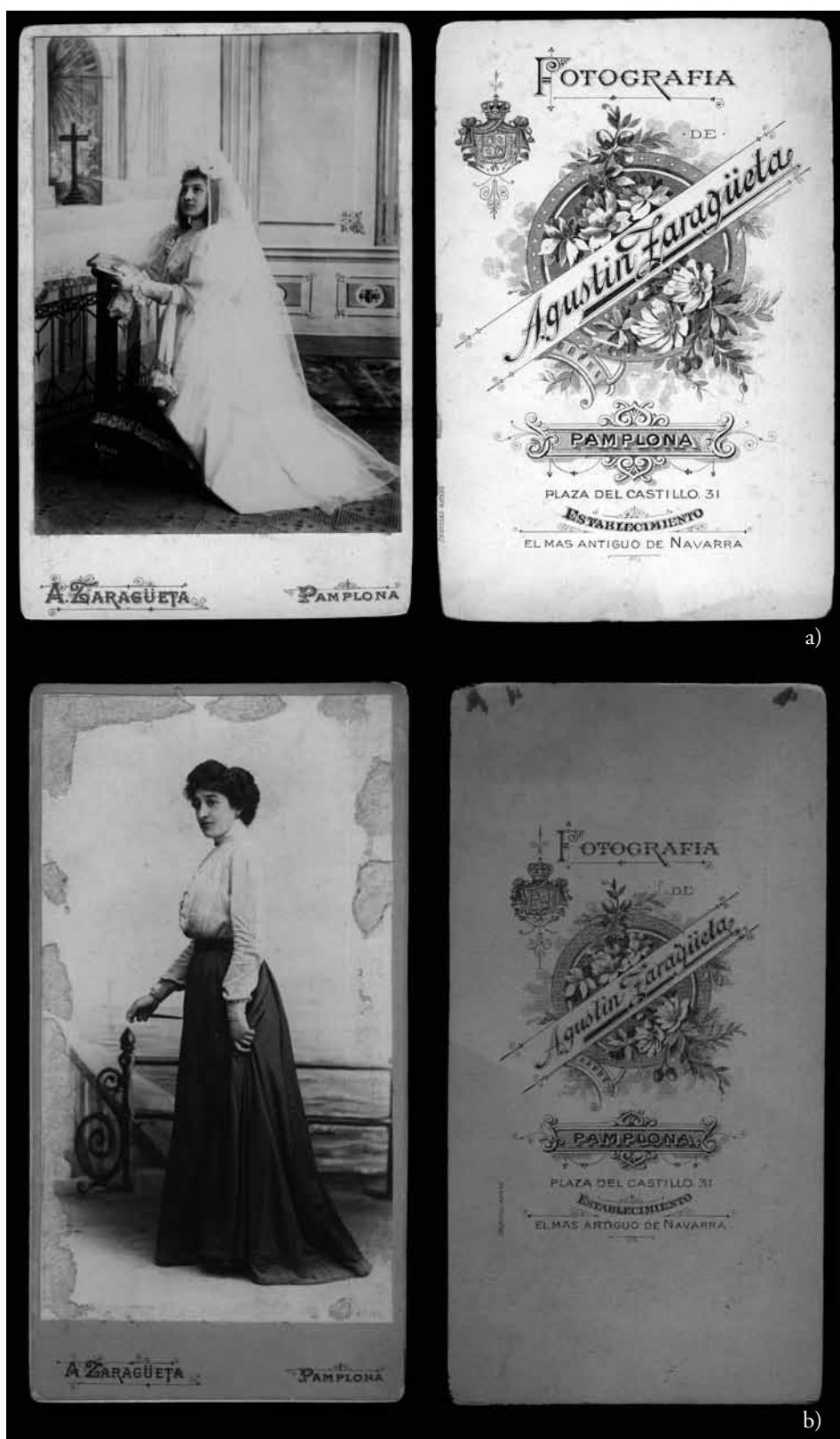
Figura 7. a) Agustín Zaragüeta. Retrato de niña de primera comunión en formato carte de cabinet (c. 1890). Papel a la albúmina. 16,8x10,7 cm.; b) Agustín Zaragüeta. Retrato de mujer en formato carte de cabinet (c. 1900). Colodión mate virado al oro platino. 16,4x8,2 cm.