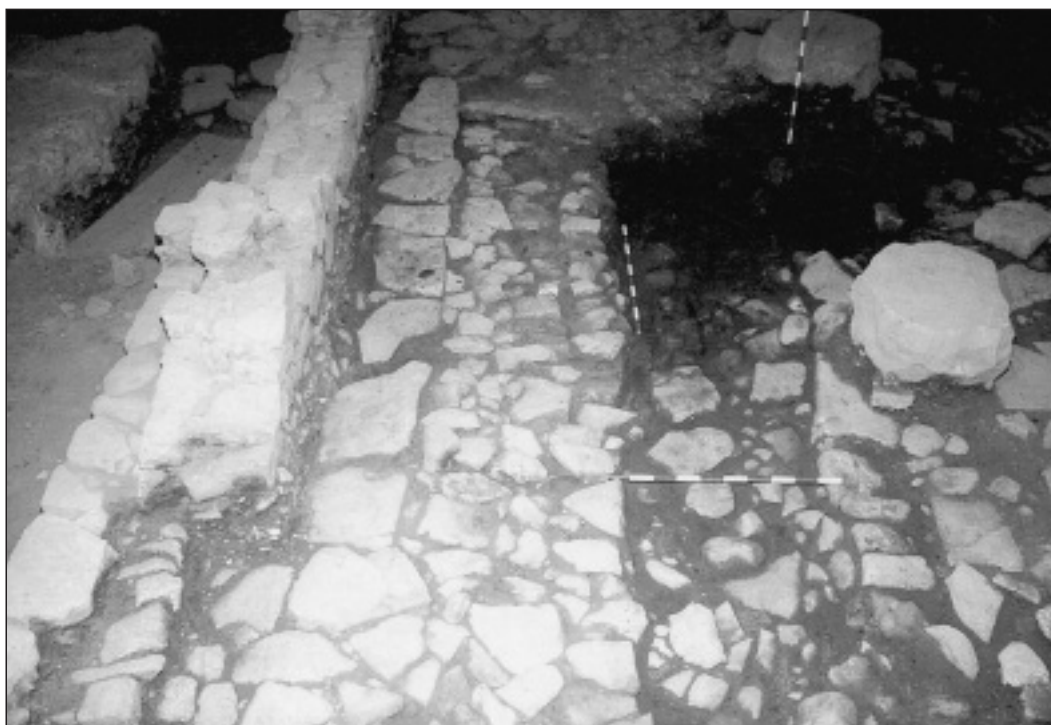
Fig. 3. Catedral 1992. Sc. B 1.2.5.6