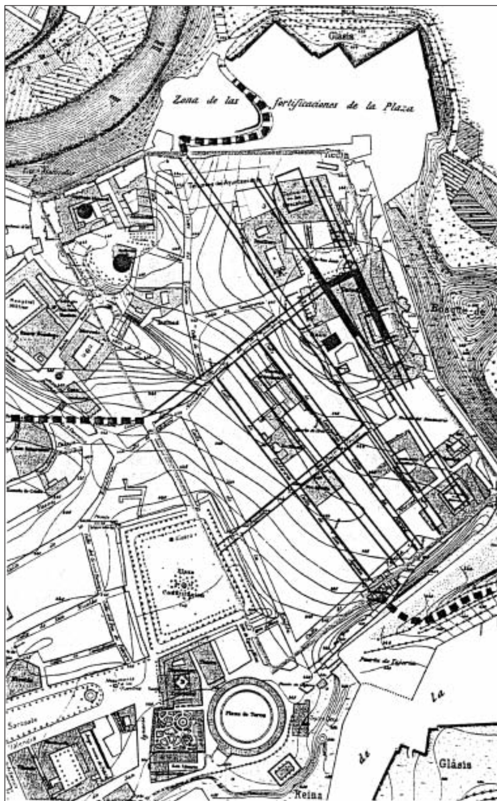
Fig. 2. Pompaelo. Trazado urbano