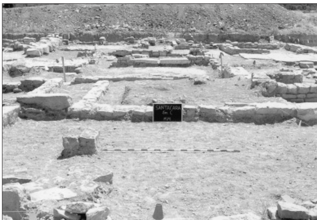
Fig. 4. Santacara