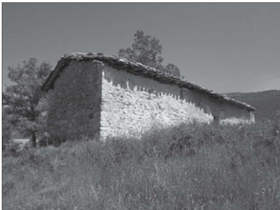
Figura 1. Vista actual de las paredes sur y este de la ermita.

El estudio de los fragmentos epigráficos de la ermita no termina aquí. En el año 2009 fueron entregados en el Museo de Navarra dos nuevos fragmentos epigráficos encontrados en los alrededores de la ermita. Los depositantes fueron J. M. Loizaga y F. Relloso, quienes junto a las piezas incluyeron un artículo con su primera descripción y transcripción, más dos nuevas inscripciones del interior de la ermita sobre las que trataremos a continuación. El artículo permanece inédito hasta ahora y esperamos que vea pronto la luz 21 .