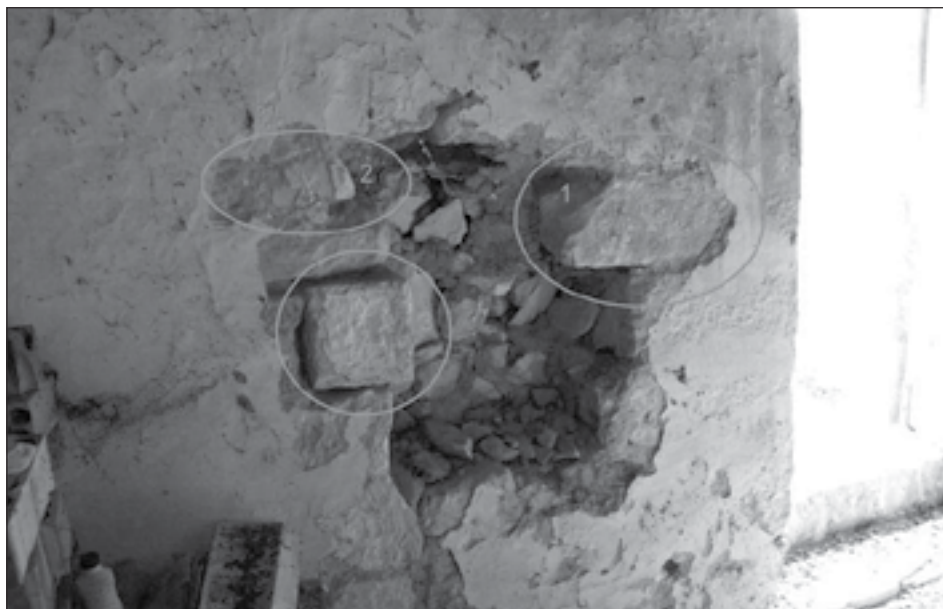
Figura 3: Estado de la pared este después del intento de expolio del aguabenditera. 1. Fragmento de inscripción funeraria. 2. Fragmento decorativo de inscripción. 3. Sillar trabajado curvo, quizás una dovela.

Los dos fragmentos que aparecieron por la acción de los furtivos permanecen a la vista de cualquier visitante, sin ningún tipo de protección y fueron descritos por Loizaga y Relloso en el artículo inédito mencionado: