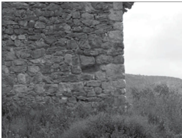
Figura 6: Hueco dejado probablemente por el expolio de una inscripción en la pared sur. Más abajo a la derecha, pueden apreciarse también otros huecos rellenos con cemento.

Por otro lado, la pared exterior del lado oeste muestra un hueco que probablemente ocupase una piedra con inscripción y que habría sido arrancada, aunque desconocemos el momento en que pudo haber ocurrido.