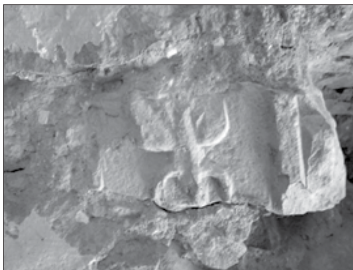
Figura 5: Fragmento decorativo de inscripción.

A pesar del estado fragmentario del texto, es indudable que se trata de una inscripción funeraria, por la fórmula final y porque el resto de las veintiún inscripciones del lugar tienen esta finalidad. Una M en la primera fila es muy dudosa, y en la segunda fila podría intuirse una N pero la distancia entre el segundo y el tercer trazo lo hace menos probable 23 . En la tercera línea, sobre el último trazo se aprecia una línea horizontal más profunda que podría interpretarse como ANT, aunque optamos por AN(norum) , ya que los dibujos de De Miguel en 1788 y Landa de 1868 reflejan que la inscripción perdida CIL , II, 5828 tenía este mismo detalle para esta abreviatura, además de que la mención a los años del difunto coincide perfectamente con este lugar de la inscripción, como ocurre en CIL , II, 5800, HEp 5, 1995, 616 o IRMN 46 24 .