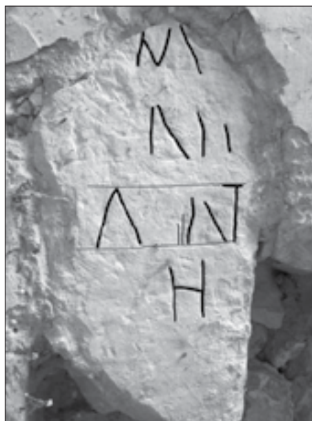
Figuras 4.1 y 4.2. Fragmento de inscripción. A la izquierda, fotografía original. A la derecha, sobreimpresión de los trazos identificables.