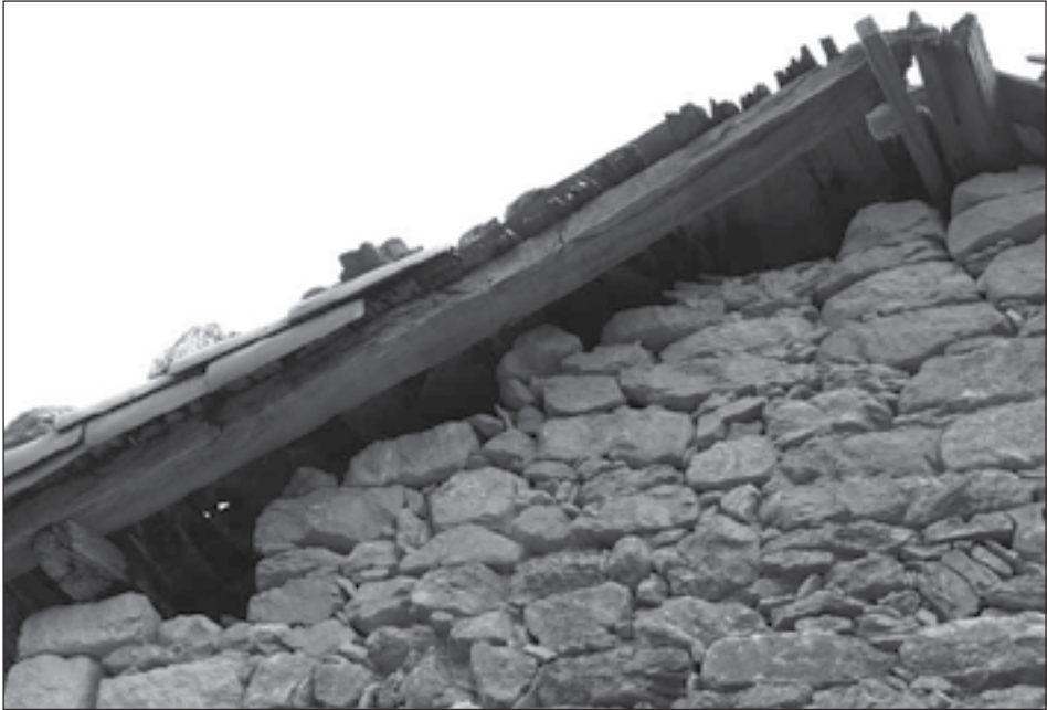
Figuras 2.1 y 2.2: Imagen exterior e interior de la cubierta.