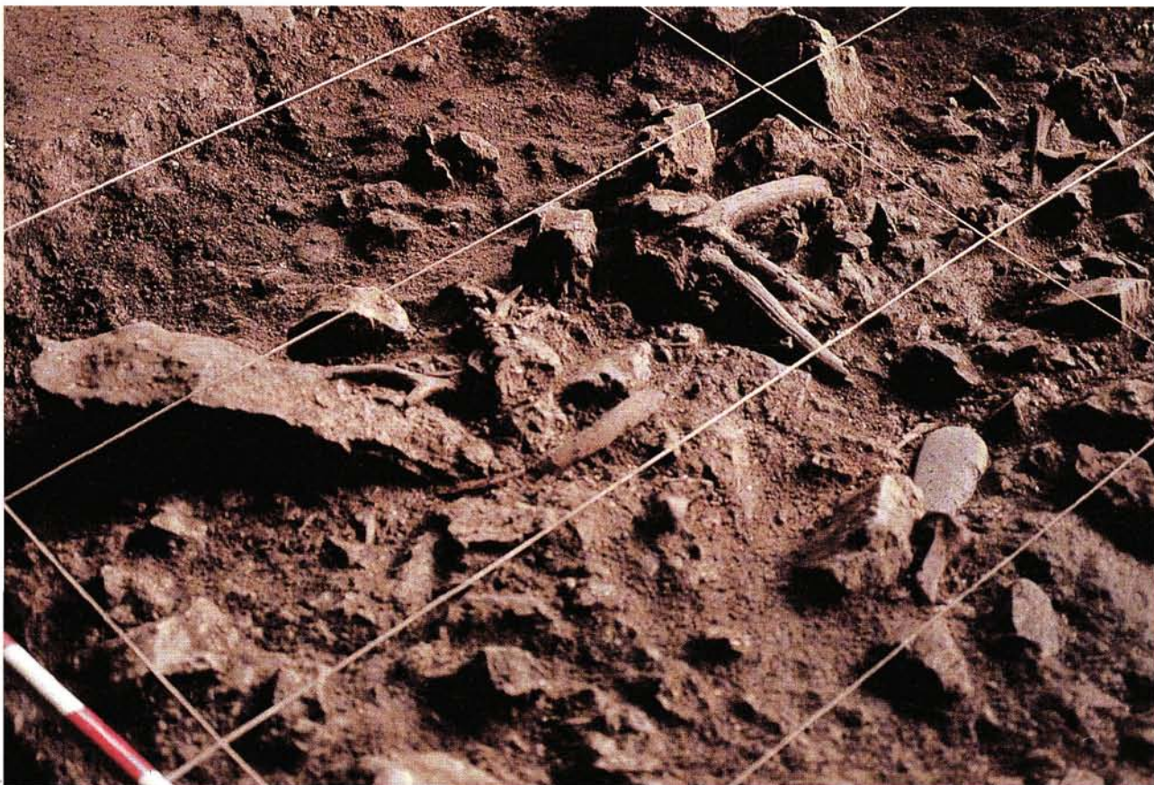
Detalle de la ocupación mesolítica del nivel B.