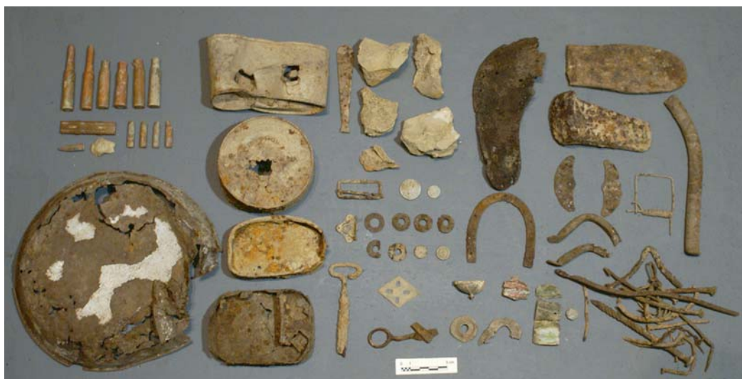
Figura 2. Muestra de algunos de los objetos recogidos.

Del primer conjunto, hay poco más de treinta objetos, en su mayoría vainas de cartucho, algunos cartuchos completos y balas de fusil, además de algún peine de balas. La mayoría corresponde a munición típica del ejército en esos años, de 7 x 57 mm Mauser, varias de ellas de fabricación española 5 . No obstante, es destacable la presencia de una vaina de 7.62 x 54 R/7.62 x 54 R Russian Mosin-Nagant 6 y dos de munición 6,5 x 52 M.1891/6.5 Mannlicher Carcano de origen italiano. Los que conservaban marcas de fecha legibles son en su mayoría de 1938 y 1939.