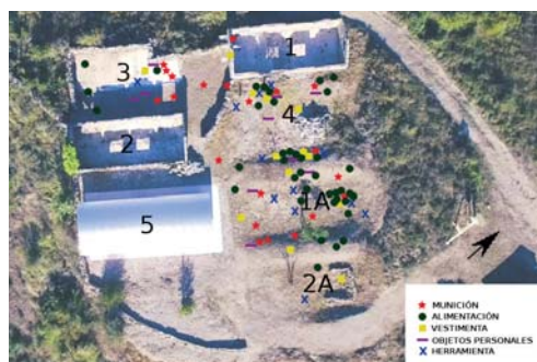
Figura 1. Imagen aérea del campo de prisioneros de Igal con la localización de los objetos recogidos.

El área investigada en la prospección magnética abarca 340 m 2 y se divide en dos zonas. La menor es de unos 85 m 2 , situada al sudoeste del campo, en la parte que habría ocupado el último barracón de este extremo. La otra zona, de 255 m 2 , se sitúa en la mitad norte del campo, sobre las ruinas de uno de los barracones de bloque y entre dos de las improntas de los barracones originales de madera y chapa. Pese a ser un área bastante reducida, el número de evidencias recuperadas es significativo, con más de 390 objetos