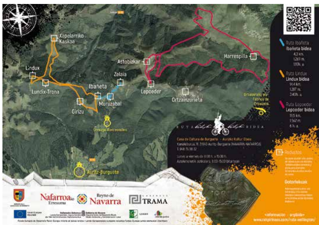
Figura 2. Parte del folleto explicativo de la Ruta Wellington.