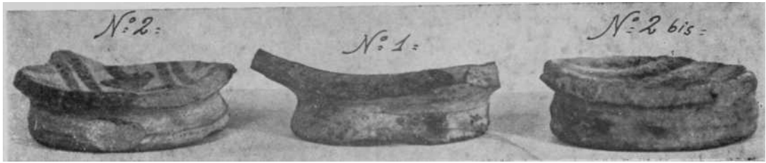
Fragmentos.—N.º 1, n.º 2 y n.º 2 bis «de perfil»