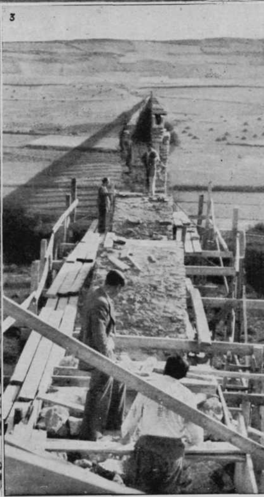
ACUEDUCTO DE NOAIN.—1. Vista de conjunto durante las obras. 2. Encimbrado de los arcos. 3. Terminación de las roscas de los arcos.