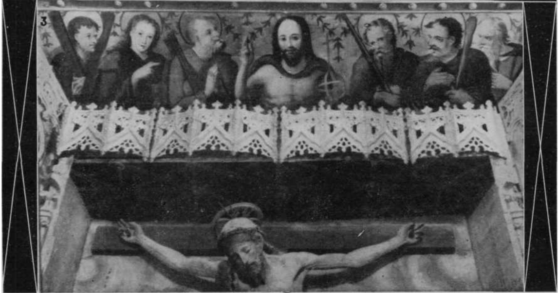
OLITE.—Retablo de Santa María la Real. Detalles del guardapolvos