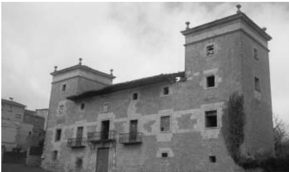
Foto 1. El palacio de Viguria

También los dos varones, tío y sobrino, hicieron muy buenas migas y, según parece, el joven tomó asimismo pronto las riendas de la hacienda, llevando con escrupulosa meticulosidad las cuentas de la administración.