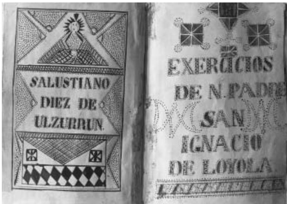
Foto 3. Autor y título del libro

actividades agrícolas, económicas y familiares. Queda por reseñar un tercer cuaderno que es más bien la copia manuscrita de un librito de ejercicios espirituales de San Ignacio de Loyola.